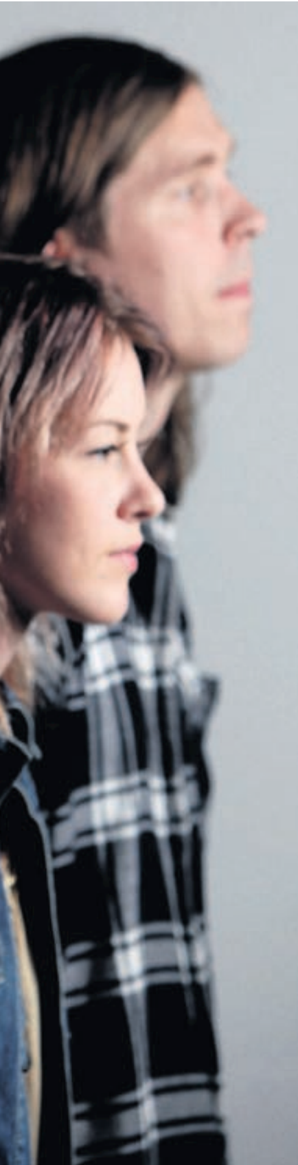
Vel fram á tónleikunum í Kína, eftir hin