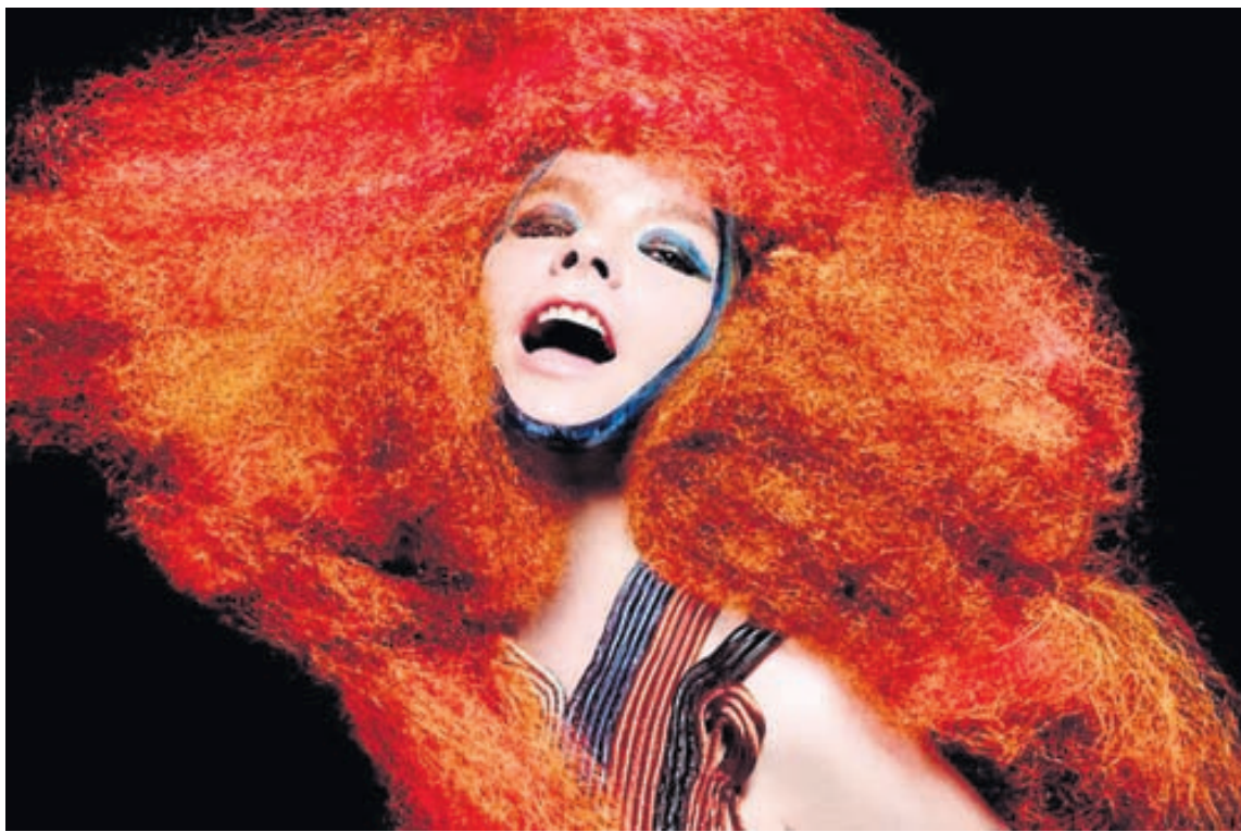
BJÖRK Biophilia er sjöunda hljóðversplata Bjarkar á enskri tungu.

Plata Skálmaldar, Baldur, var nýverið gefin út erlendis og hefur hún undantekningalítið fengið góða dóma. Þar má nefna 7 af 10 mögulegum hjá hinu þekktu tímariti Metal Hammer og 4 af 5 á síðunni Metalcrypt.com. - fb