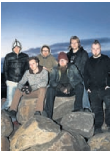
KEPPNISTÚR Rokkararnir í Skálmöld eru á leiðinni í tónleikaferð um Evrópu í haust.

Tónleikaferðin kallast Heidenfest og er þetta þriðja árið í röð sem hún er farin. „Þessi ferð er skipulögð af fyrirtæki sem er með nokkur mini-festivöl á sínum snærum. Við þurfum voða lítið að gera nema að vera í rútnunni þegar hún leggur af stað. Það er allt mjög „professional“ í kringum þetta.“ Flestir tónleikarnir verða í Þýskalandi og flestir verða