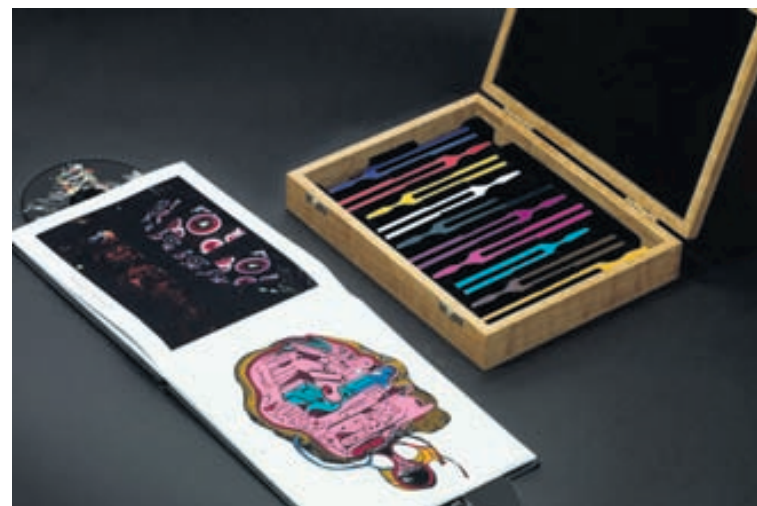
BIOPHILIA Tíu krómaðar tónkvíslir í tíu mismundandi litum fylgja með boxinu.

Biophilia hefur verið lýst sem heimsins fyrstu app-plötunni. Fyrir peninginn sem boxið kostar myndu sumir ætla að iPad-græja fylgdi með í kaupunum en svo er ekki. Fyrir 500 pund, eða um 93 þúsund krónur, fá kaupendur sendan heim til sín forláta viðarkassa með 48 blaðsíðna safaríkum Biophilia-bæklingi og tíu krómuðum tónkvíslum í tíu mismundandi litum. Hver tónkvísl um sig hefur verið gerð sérstaklega fyrir hvert lag á plötunni en þau eru tíu talsins. Að sjálfsgöðu fylgir Biophilia-platan einnig með í kaupunum ásamt upptöku frá nýlegum tónleikum Bjarkar á listahátíðinni í Manchester.