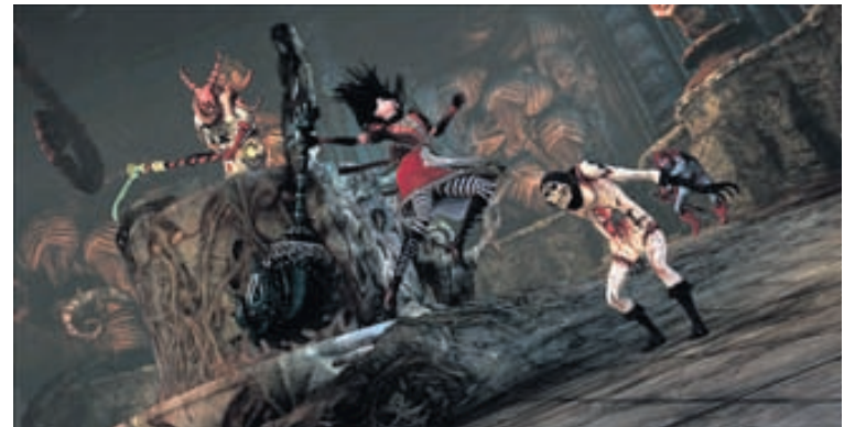
ÖÐRUVÍSI Þetta er ekki sama saklausa Lísu í Undralandi og fólk sá í hinni klassísku Disney-teiknimynd.