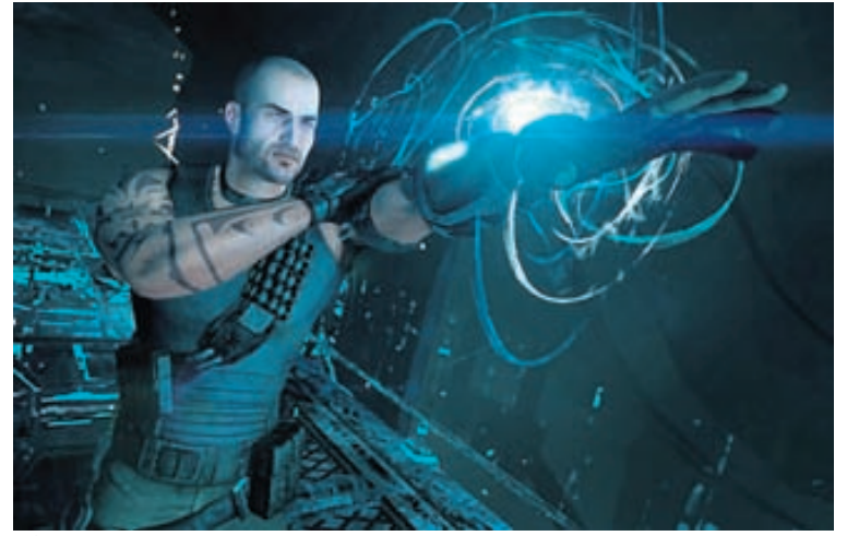
HÁTÆKNI Nano Forge-tæknin auðveldar mönnum að lifa af og taka til í Red Faction: Armageddon.

Það er líklegt að þeir sem spiluðu forvera leiksins, Red Faction: