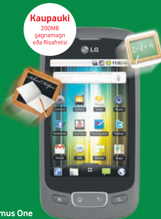
LG Optimus One