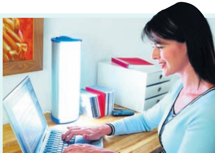
Vaktavinna hefur truflandi áhrif á líkamsklukkuna.