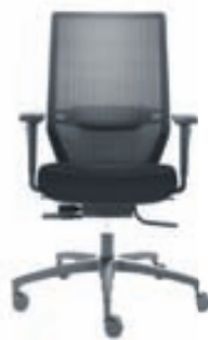
Shape frá Dauphin

Fullt verð 125.534 kr. Tilboðsverð 99.950 kr.