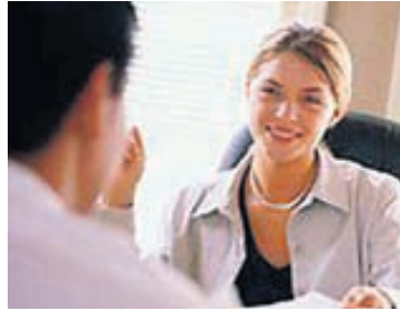
Brostu til samstarfsfólks þíns, það skilar sér í betri líðan á vinnustað.

Fyrsta skrefið til að bæði þér og fólkinu í kringum þig líði vel í vinnunni er að þér líki við starfið. Vertu viss um að þig langi í stöðuna áður en þú sækir um og þú getir hugsað þér að sinna starfinu um lengri tíma.