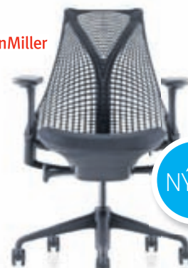
SAYL frá HermanMiller

Fullt verð 119.900 kr. Tilboðsverð 95.950 kr.