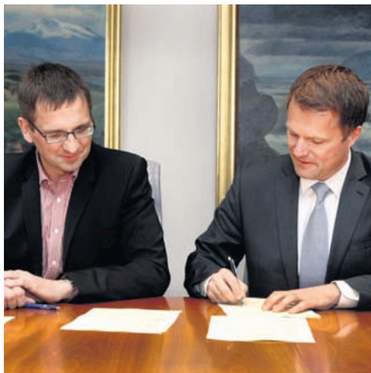
Um 6.500 fyrirtæki um allt land eru í viðskiptum við Vodafone. Þeirra á meðal eru allir helstu neyðar- og viðbragðsaðilar landsins.