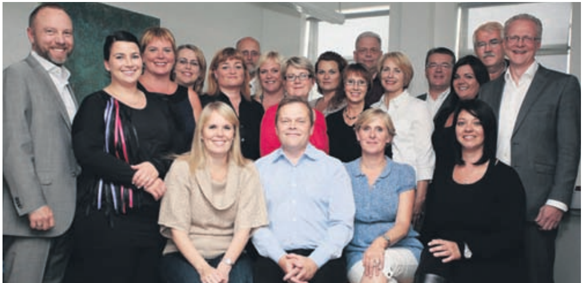
Starfsfólk Iðunnar tekur vel á móti fróðleikspyrstum starfsmönnum fyrirtækja.

afar fjölbreyttan hóp vinnustaða af öllum stærðum. „Við erum með eigin dreifingu á höfuðborgarsvæðinu, á Snæfellsnesi austur til Hvolsvallar og allt þar á milli og frá Hrutafirði austur til Húsavíkur. Í tilviki þeirra vinnustaða sem ekki eru innan þessa svæðis þá notum við þriðja aðila til að koma vörunni tímanlega og örugglega á áfangastað. Það eiga allir að geta nýtt sér þjónustu Hressingar.“