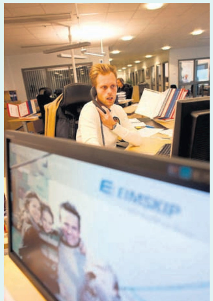
Einn af 49 starfsmönnum Eimskips á skrifstofu félagsins í Rotterdam.

Eimskip | Korngördum 2 | 104 Reykjavík | Sími 525 7000 | www.eimskip.is