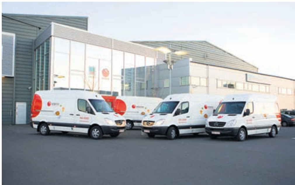
Selecta á Íslandi er hluti af fyrirtækjaþjónustu Innnes ehf. sem er ein af stærstu matvöruheildverslunum landsins.

Selecta á Íslandi býður hágæðalausnir fyrir hótél, kaffi- og veitingahús. Fyrir afkastamik-