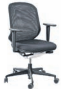
MedaPal frá Vitra

Fullt verð 125.785 kr. Tilboðsverð 99.950 kr.