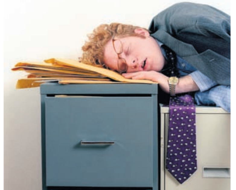
Ef þér finnst þú ekki geta þroskað hæfileika þína í vinnunni skaltu íhuga annað starf.

Það er undir sjálfri/sjálfum þér komið hver frami þinn í starfi