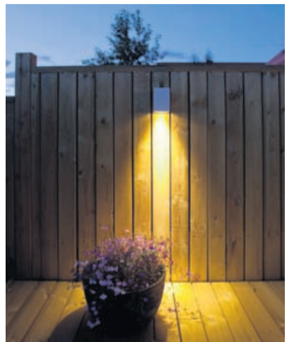
Íslenska útljós Moli á sér tilvísun í glóandi hraunmola og gefur frá sér afar hlýja og notalega birtu.

„Við leggjum áherslu á að framleiðendur okkar vandi mjög til smíði og húðun ljósanna sem öll eru pólýhúðuð og bökðuð, en það tryggir góða endingu á yfirborði ljósa.“