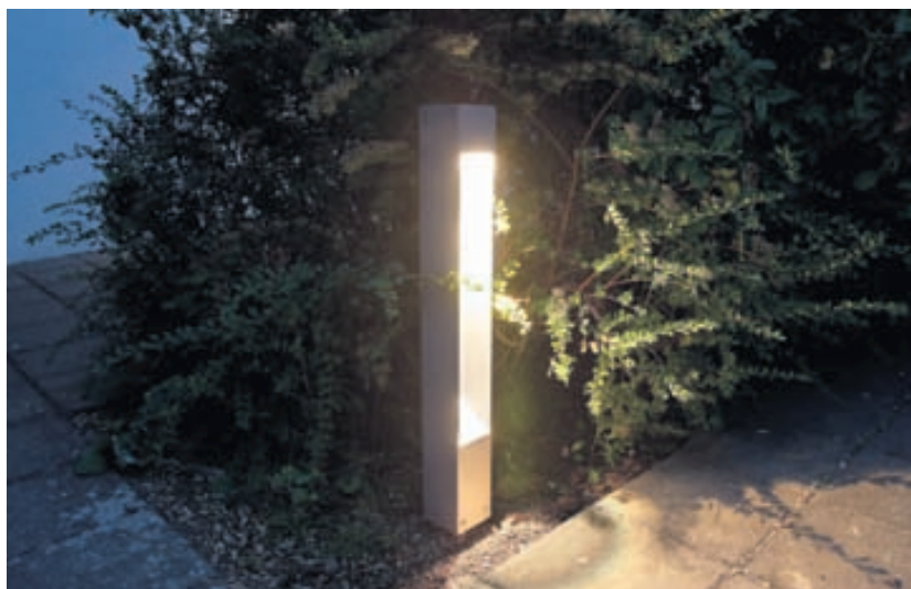
Þessi lági ljósaustaur kallast Magni í höfuðið á aðalgignum í gosinu á Fimmvörðuhálsi.

Íslenskir ljósahönnuðir hafa látið ljós sitt skína eftir bankahrúnið 2008, en þá hækkuðu innflutt ljós mjög í verði. Íslensk útljós eru í senn falleg og hagstæður kostur. Mikið er lagt upp úr gæðum og góðu úrvali, eins og sjá má í sýningarsal Prodomo þar sem íslensk ljós eru fyrirferðarmikil þessa dagana.