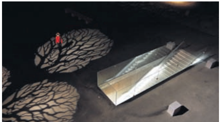
Dæmi um fallegt samspil ljóss og skugga með útljósum frá S. Guðjónsson við Hörpu. Lýsing hönnuð af Verkis.