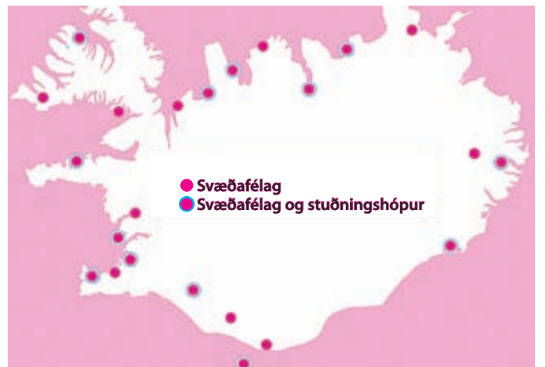
● Svæðafélag ● Svæðafélag og stuðningshópur