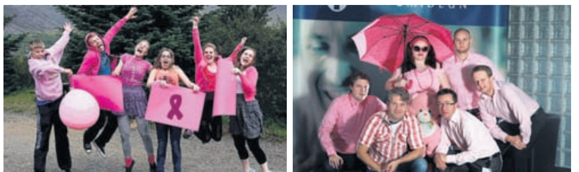
Starfsmenn ýmissa fyrirtækja tóku sig til á síðasta ári og héldu bleikan föstudag.

Treo® freyðitöflur, 500 mg Asetýlsalisýsýra og 50 mg koffein, Treo er verkjalyf sem fánlegt er án lyfseðils og er notað við höfuðverk, migreni, tannverk, þöðverk, söttthita og lið- og vöðvæðingum, Treo er ætlað til skammtamagnotkunar. Fullorðnir: 1-2 freyðitöflur 1-3 sinnum á sólarhring. Börn: Lyfjafélagið er ekki ætlað börnum yngri en 7 ára, 7-14 ára: 1/2 freyðitöfla 1-3 sinnum á sólarhring, mest 2-3 daga í senn. Freyðitöflurnar á að leysa upp í 1/2 glasi af vatni. Þeir sem eru yngri en 18 ára ættu ekki að nota Treo við söttthita án samráðs við lækni. Vegna mikils natríuminnihalds lyfsins hentar það ekki þeim, sem hafa háan blóðþrýsting, hjartabilun eða skerta nýrnastarfsemi. Notist ekki samtímis blóðþynnningarlyfjum. Ekki heldur ætlað sjúklingum með maga- og skeifugarnarsár, astma eða öfnaemi fyrir innihaldsefnum lyfsins. Þungaðar konur eiga ekki að taka inn lyfið nema í samráði við lækni. Algengustu aukaverkanir eru meltingarþægindi. Lesið allan fylgiseðilinn vandlega áður en byrjað er að nota lyfið. Geymið fylgiseðilinn. Nauðsynlegt getur verið að lesa hann síðar. Handhafi markaðsleyfis: McNeil Denmark ApS. Umboð á Íslandi: Vistor hf., Hörgatún 2, Garðabæ.