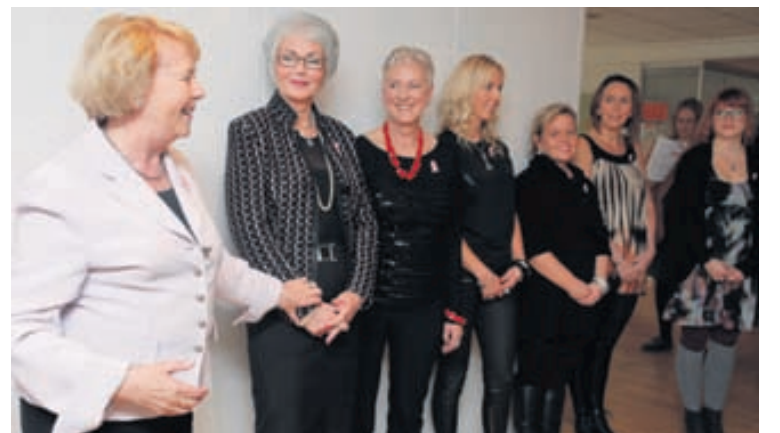
Vigdís Finnbogadóttir með þeim sex konum sem fyrstar fengu afhentar Bleiku slaufuna í ár.

Á hverju ári velur Krabbameinsfélagið eina byggingu á höfuðborgarsvæðinu til að lýsa upp í tilefni átaksins og var efsta hæð turnnsins í Höfðatorgi lýst bleiku ljósi að þessu sinni. Það voru Verkis og Exton sem studdu Krabbameinsfélagið við lýsinguna, sem og Eykt, eignarhaldsfélag Höfðatorgs. Ýmis mannvirki hafa einnig verið lýst um land allt og má m.a. nefna álverið við Reyðarfjörð og Húsavíkurkirkju en einnig náttúrufyrirbæri sem heitir því skemmtilega nafni Bleiksárfoss og er á Eski-firði. Einnig hafa fyrirtæki um allt land tekið sig til og lýst byggingar sínar upp í tilefni af árveknismánuðinum. Lýsingin