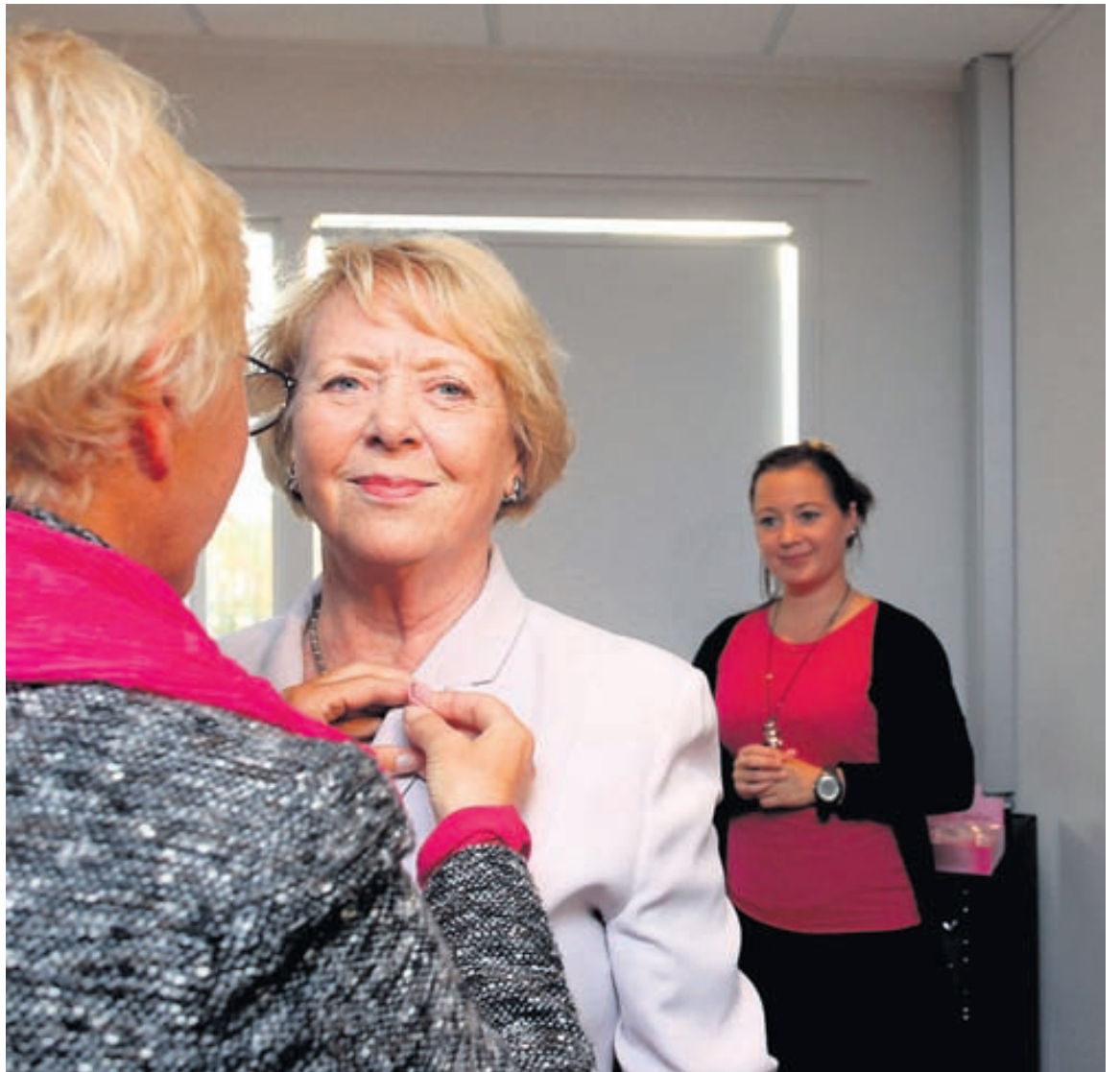
Vigdís Finnbogadóttir fær hér afhenta Bleiku slaufuna. Vigdís greindist sjálf með brjóstakrabbamein árið 1977.