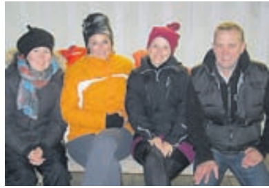
Hluti af hópnum slakar á fyrir utan Kirkjumiðstöðina á Eiðum.

Dagana 26.-28. ágúst 2011 var krabbameinsgreindum og aðstandendum boðið að koma og taka þátt í orlofshelgi að Eiðum á vegum Krabbameinsfélags Austfjarða og Krabbameinsfélags Austurlands. Í Kirkjumiðstöð Austurland var boðið upp á fræðslu, svæðanudd, gönguferðir, helgistund, samveru og fleira og nutu þátttakendur helgarinnar svo sannarlega.