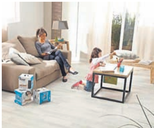
Gólfefnin frá Tarkett njóta mikilla vinsælda í heimahúsum.

Það skiptir engu hvort um er að ræða opinbera