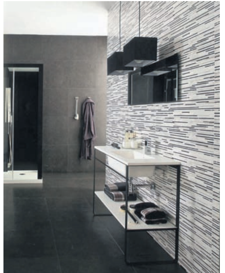
Treviso. Porcelanosa býður upp á mikið úrval flísa með mosaík-útliti.