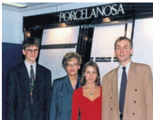
Fjölskyldan tók við rekstrinum fyrir aldarfjórðungi.

tekur fram að fyrirtækið setji ávallt lágmarksverðmið í gæðum.