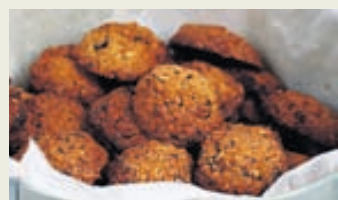
Smákökur væru í verðlaun fyrir jólahreingerningu á vinnustað.

Til að kóróna stemninguna er einboðið að láta Connie Francis og Andy Williams sjá um tón-listina, sem einkorðast að sjálf-sögðu við alkunna jólaslag-ara.