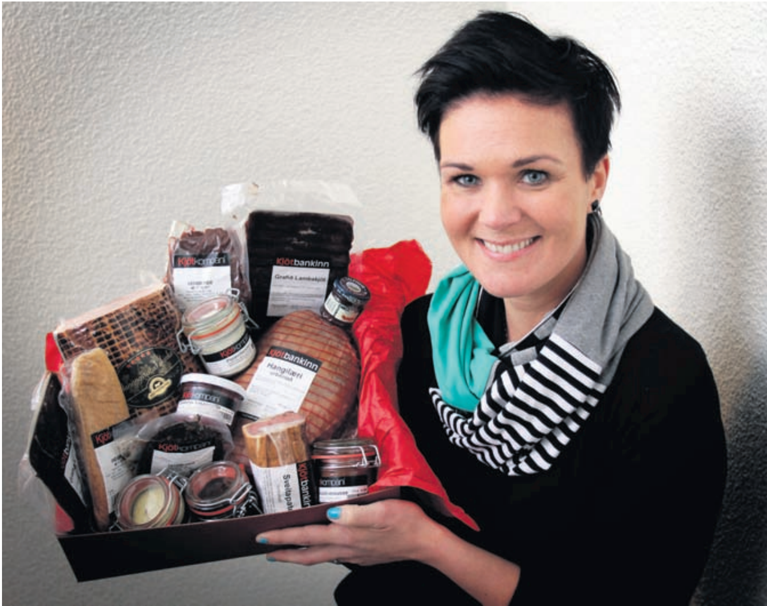
Gjafakörfurar fást í ýmsum útgáfum og er hægt að velja í þær að villd. Boðið er upp á kjöt af ýmsu tagi, sósur, konfekt og kaffi.

Kynningarblað Hugmyndir, matur, góðgerðamál, kjötmeti, gjafakort, gleði.