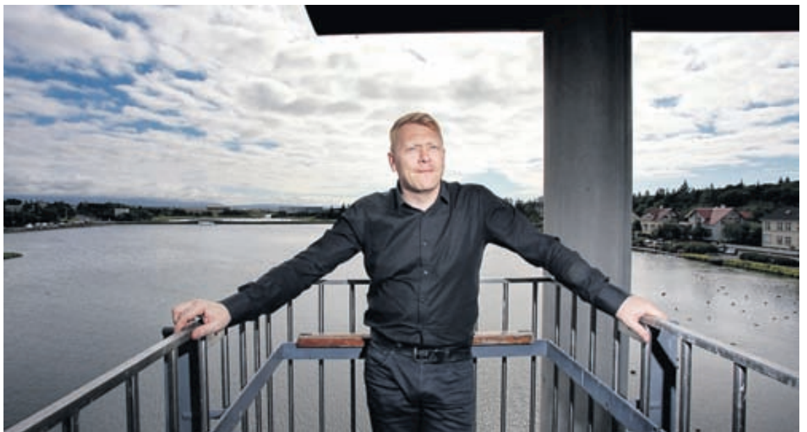
Menningarkort Reykjavíkur er tilvalin jólagjöf segir Jón Gnarr borgarstjóri.

Menningarkort Reykjavíkur - listilega góð jólagjöf