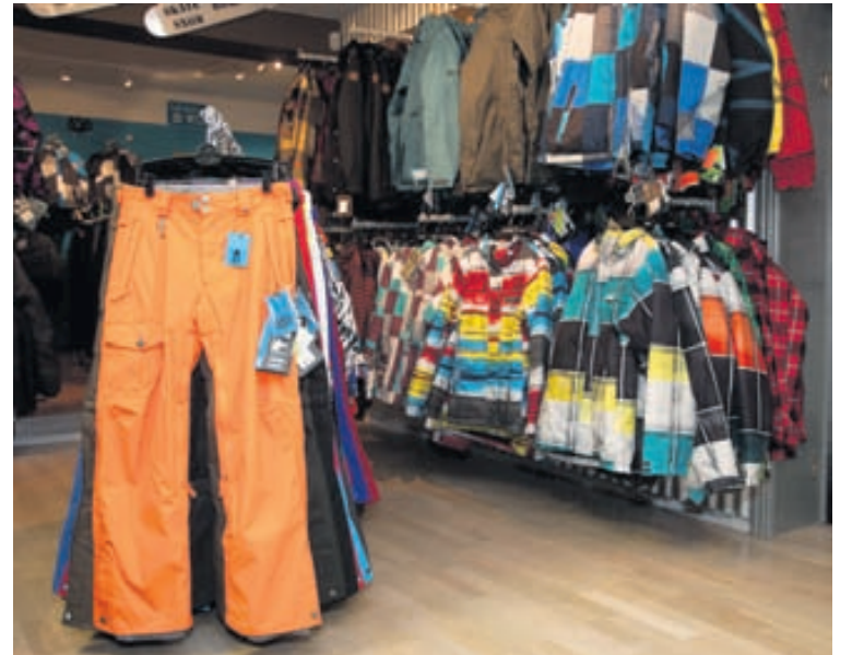
Mikil litadýrd einkennir bæði úlpurnar og buxurnar í Brimi.