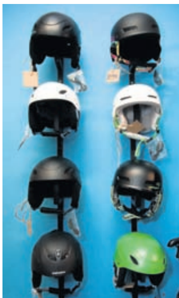
Hjálmanotkun hefur aukist mikið á Íslandi.