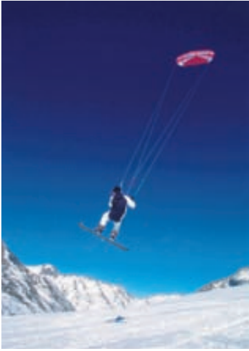
Sumir nýta sér fallhlífur til að komast áfram.