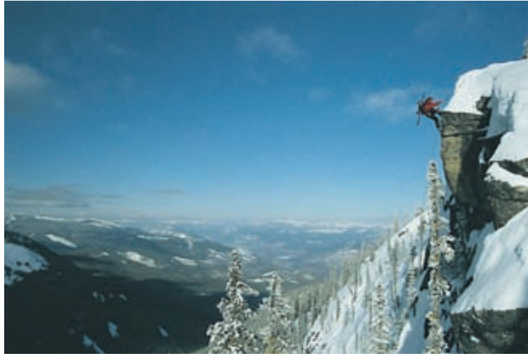
Sumir leggja meira á sig en aðrir til að renna sér frá bestu stöðunum.