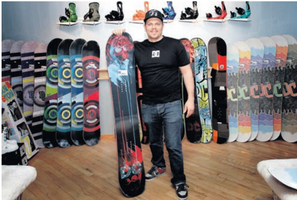
Mohawks – Snjór og steypa hefur séð um hjólabrettaviðburði í gegnum tíðina en nú er stefnan tekin á snjóbrettasenu.