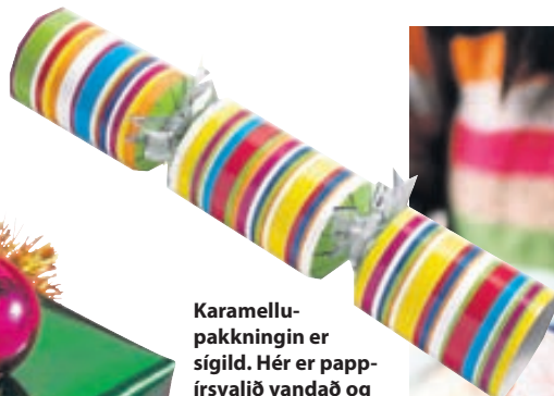
Karamellu-pakkningin er sígild. Hér er pappírsvalið vandað og þá þarf ekki mikið meira til.