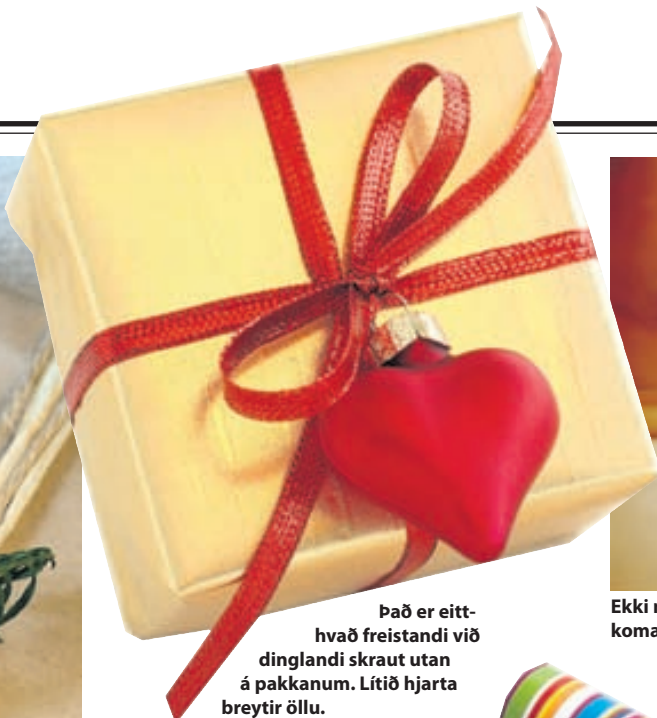
Það er eitt-hvað freistandi við dinglandi skraut utan á pakknum. Lítið hjarta breytir öllu.