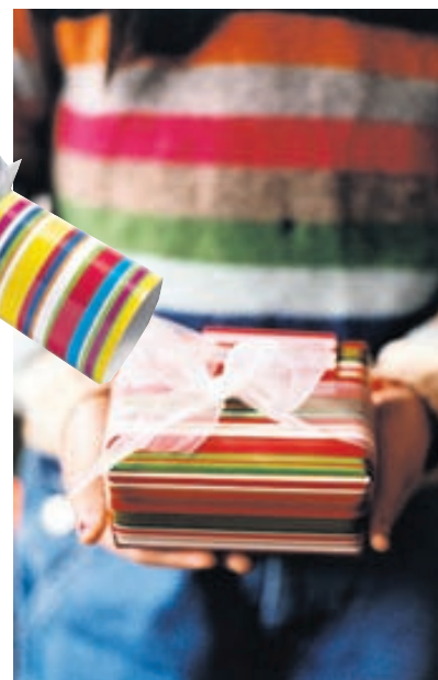
Flestum hlýnar um hjartað við að fá pakka í fallegum umbúðum sem nostrað hefur verið við.