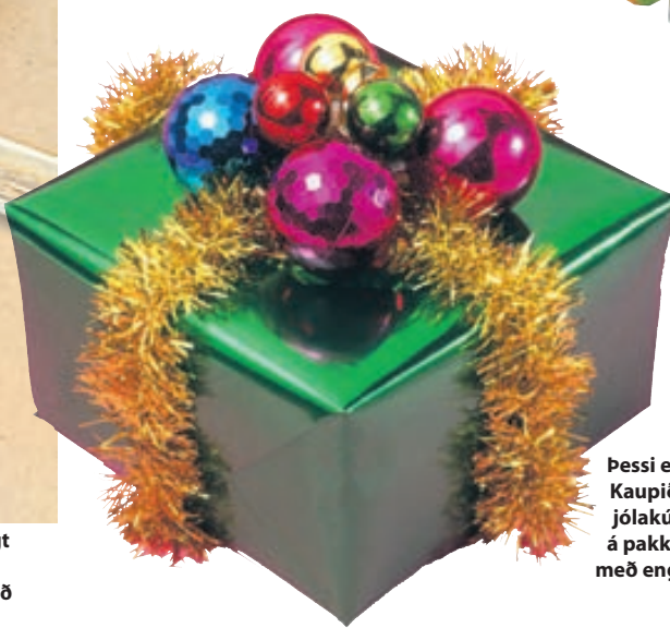
Þessi er nú sætur! Kaupið nokkrar jólakúlur og festið á pakkann. Toppið með englahári!