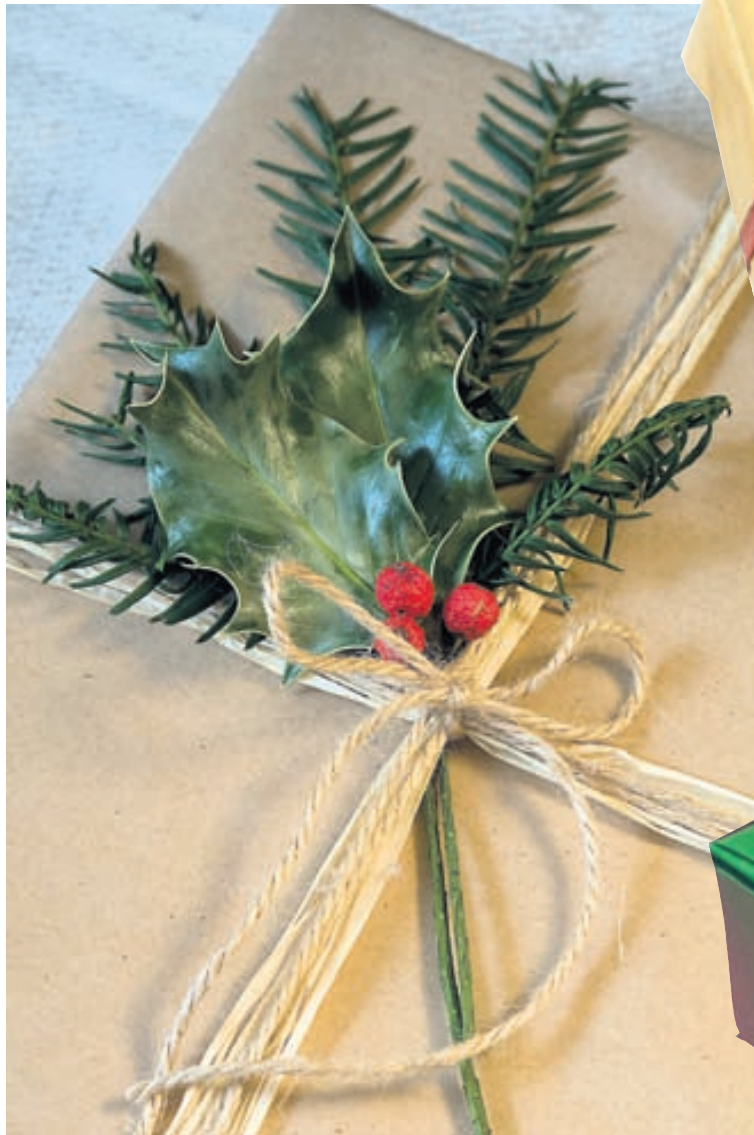
Þessi brúni klassíski klikkar seint. Einfaldleikinn gerir það að verkum að persónulegt handbragð fær hvað best notið sín og er hægt að skreyta hann með teikningum, límmiðum, lifandi blómum og blúndum svo dæmi séu nefnd. Við hann er fallegast að nota snæri upp á gamla mátann.