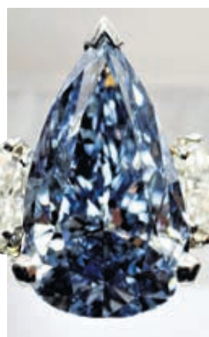
Paris Hilton splæsti á sig nýjum Bentley í jólagjöf og Mariah Carey fékk Rolls-Royce. Sienna Miller fékk demantshring frá vandræðagripnum Jude Law.