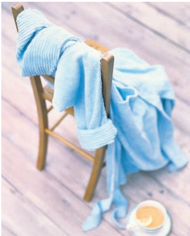
Margir gæfu mikið fyrir vandaðan og þægilegan slopp.

Þá eru karlmenn svalir sem gerast svo djarfir að kaupa fatnað á konuna sína eða kærustu því fatakaup eru vitnisburður um góða þekkingu og smekk viðkomandi.