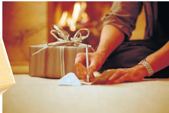
Ekki má gleyma merkimiðanum eða kortinu sem fylgir. Þar er hægt að koma kærleikanum í orð.