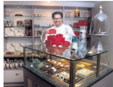
Hafliði í súkkulaðibúðinni í húsi Skúla fógeta í Aðalstræti 10. Þar verður opið til klukkan 22 fram til jóla.

„Ég er nýbyrjaður í jólainnkaupunum því mér finnst skemmtilegast að vera í bænum þegar mikið er af fólki og jólastemningin allsráðandi. Konan mín sér um stærstu innkaupin en ég fer með, segi já og nei, og tek upp budduna. Þá ætla ég með krakkana á jólamarkaðinn á Ingólfs-torgi og velja þar stafafuru í fyrsta sinn sem jólatré.“