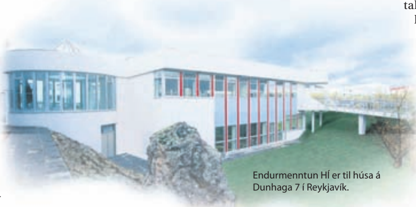
Endurmenntun HÍ er til húsa á Dunhaga 7 í Reykjavík.

endurmenntun.is, en skráning og upplýsingagjöf fer fram hjá fræðslu- og símenntunarmiðstöðvum víðs vegar um landið. Fyrirtæki og stofnanir sem eiga fjarfundabúnað geta einnig tekið þátt og hafa þá samband við Endurmenntun.