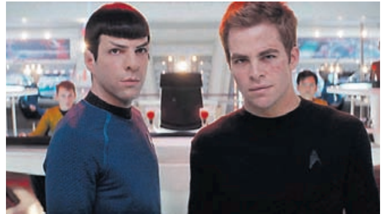
Dr. Spock í Star Trek var víst mikill heimspekingur samkvæmt námskeiði sem kennt er við háskólann í Georgetown.

kennir hann göngu sem miðast við að sýna fram á tengsl göngu við listaverk og fegurð náttúrunnar.