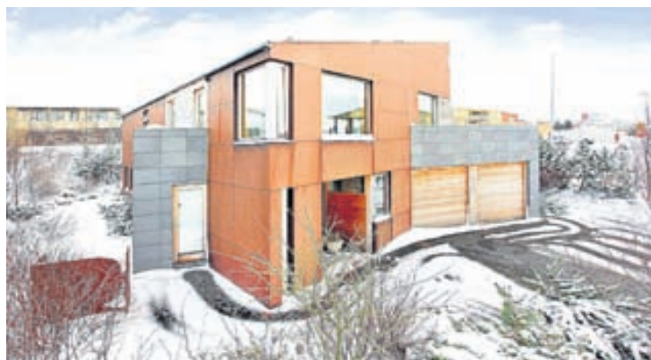
Efnisvalið á klæðningunni utan á húsinu tengist náttúrunni.