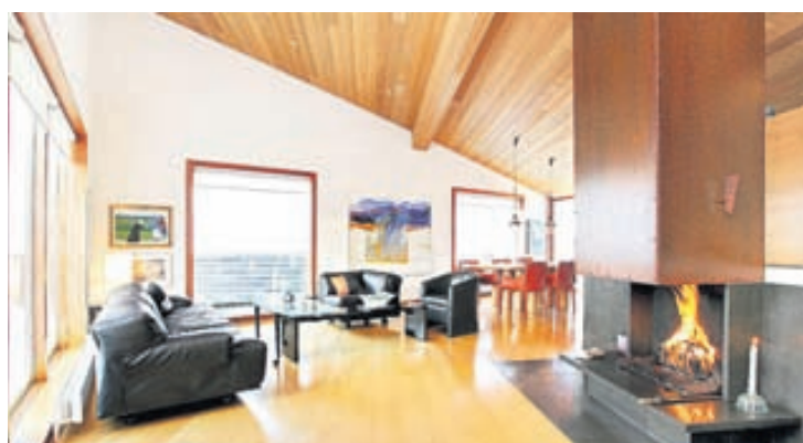
Allar innréttingar í húsinu eru sérsmíðaðar.