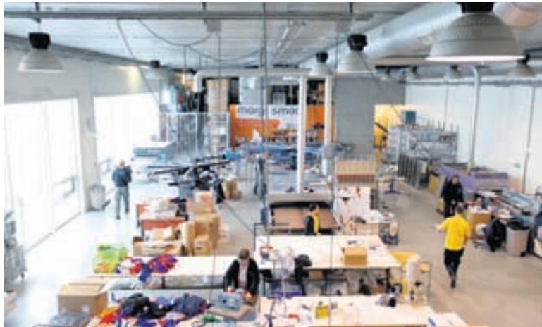
Stærsti hlutinn er framleiddur á Guðríðarstíg 6 til 8 í Grafarholti, í húsakynnum fyrirtækisins Margt smátt.

Árlega útbýr Margt smátt vandaðan bækling sem er dreift í stóru upplagi á landsvísu. „Við erum eitt af fáum fyrirtækjum hér heima í þessu fagi sem gefur reglulega út bækling á íslensku með verði í íslenskum krónum og erum því með sérstöðu hvað það varðar. Í þessum bæklingi eru yfir 2.500 hugmyndir, vörur sem eru þverskurður af því sem við bjóðum, fyrir heimilið, skrifstofuna, sumarfrið og svo framvegis,“ útskýrir Árni. „Hann er eimitt í dreifingu núna fyrir árið 2012.“