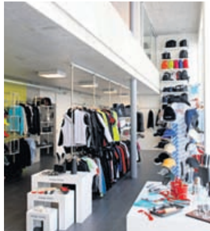
Margt smátt býður auglýsinga- og gjafavöru í fjölbreyttu úrvali.