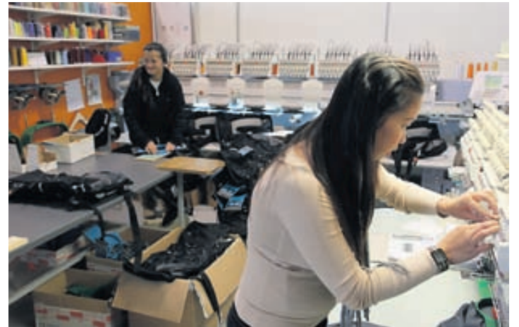
Hjá fyrirtækinu vinna 22 starfsmenn og þar af eru sjö reyndir sölumenn.