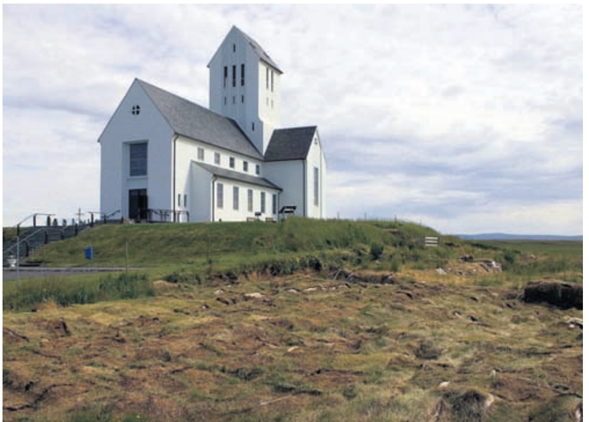
Skólahald hefur verið í Skálholti í nærri þúsund ár, þó ekki samfellt.

24 piltar voru í hvorum skóla um sig og skyldu þeir fá góðan mat og drykk eftir landsvenju, vaðmál til