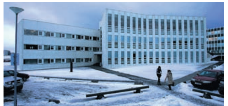
Ein bygginga Háskóla Íslands er nefnd Oddi til heiðurs Sæmundi fróða.

Námskeið í sjálfsrækt eru vinsæl og sömuleiðis tungumálanám. Einhverjir gætu haft ánægju af dáleiðslunámskeiði á meðan aðrir kjósa námskeið í verkefnastjórnun. Þrjónanámskeið hafa slegið í gegn og gott er fyrir alla að kunna á tölvu. Sumir þurfa leiðsögn á farsímann á meðan aðrir vilja læra myndlist. Köfun, sund, dans, líkamsrækt eða júdó, allt er í boði. Möguleikarnir eru óþrjótandi og um að gera að gúgla áhugasviðið og athuga hvað hægt er að finna. Námskeið líta vel út í ferilskránni um leið og þau efla andann og næra sálina.