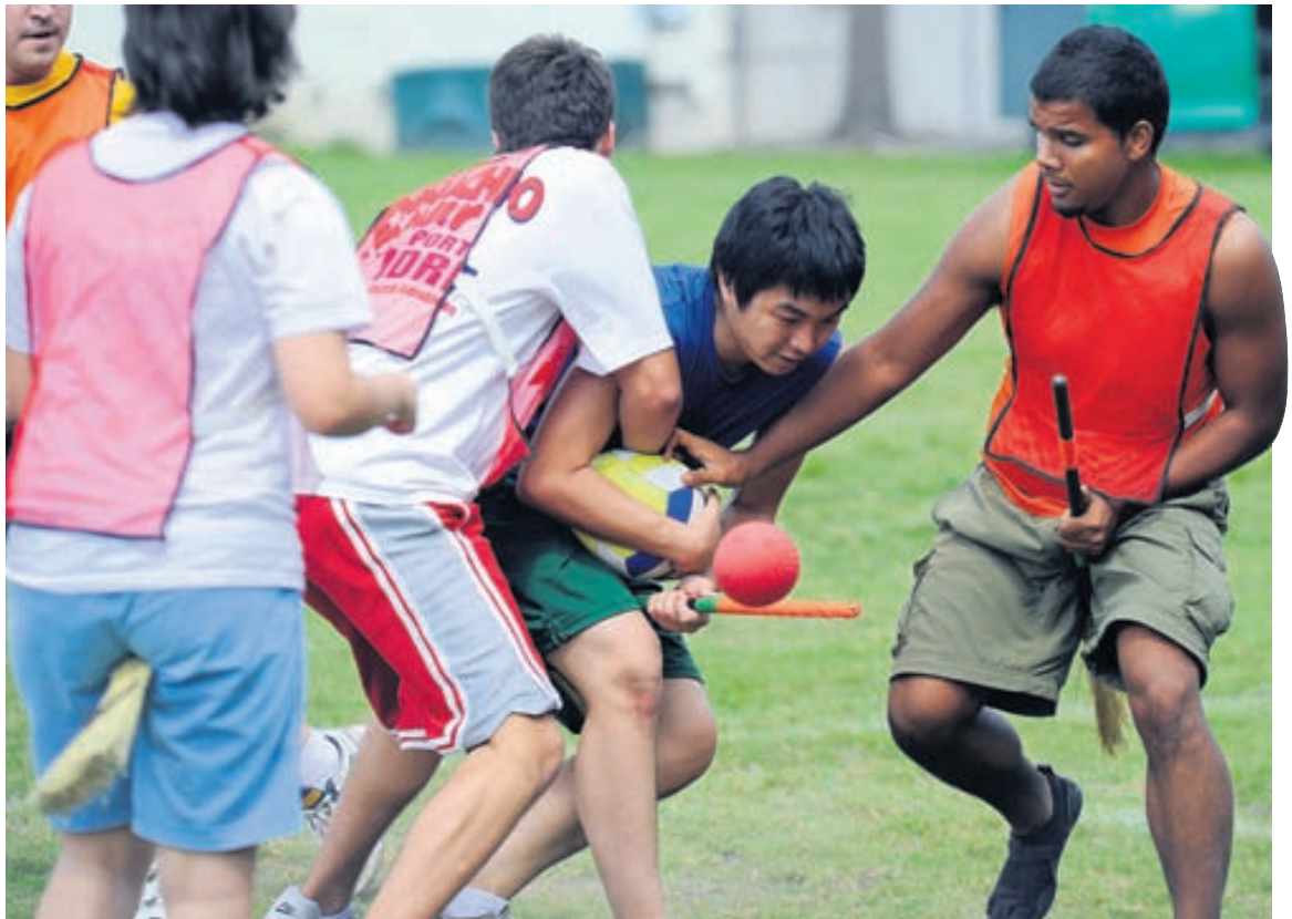
Það eru fleiri en Harry Potter sem hafa heillast af quidditch.