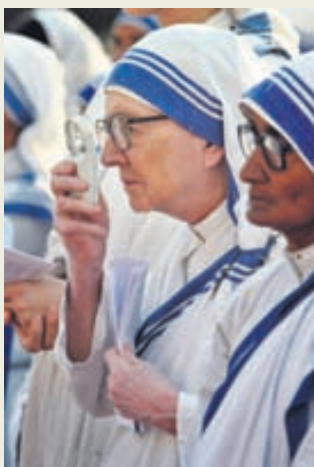
Nunnur, prestar og munkar sáu um nánast alla kennslu fyrr á öldum.

Með hröðum vexti borga á elleftu öld varð eftirspurn eftir menntun mun meiri en áður hafði þekkt og stofnanir kirkjunnar höfðu ekki svigrúm til þess að verða við henni. Í kjölfarið var komið á fót háskólum með svipuðu sniði og við þekkjum þá í dag. Sá fyrsti hóf starfsemi í Bologna árið 1088 og fljótlega upp úr því var stofnaður háskóli í París, sem reyndar stóð á gömlum merg kápólsks skóla. Oxford og Cambridge stofnuðu sína háskóla í kringum aldamótin 1200 og fyrr en varði fylgdu aðrar borgir víða um Evrópu fordæmi þeirra.