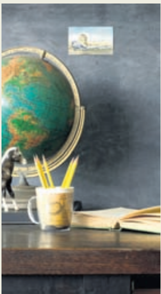
Það að eiga fastan stað fyrir heimalærdóminn er vænlegt til árangurs.

Enginn norrænn háskóli er í fimmtíu efstu sætum listans en Háskólinn í Árósum vermir 79. sætið og háskólarir í Uppsala og Lundi í Svíþjóð sitja í 83. og 86. sæti.