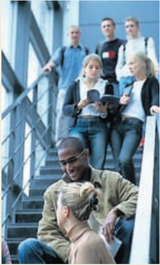
Breskir og bandarískir háskólar skara langt fram úr öðrum samkvæmt vefsíðunni usnews.com.