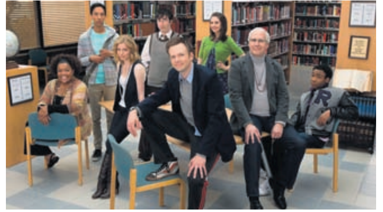
Tungulipur lögfræðingur sem lítur stórt á sig í fyrstu áttar sig á gildi mannlegra tengsla þegar hann sest aftur á skólabeck og kynnist sundurleitum hópi samnemenda sinna.

tungulipran lögfræðing sem skikkaður er aftur á skólabeck þegar upp kemst að hann falsaði prófskírteini sitt. Í kringum hann safnast sundurleitir hópur fólks sem hann telur sig í fyrstu eiga lítið sameiginlegt með. Hann sé „svalari“ en þau og lítur á sig sem leiðtoga þeirra. Hópurinn hittist reglulega til að læra saman. Eftir því sem líður á tengjast þau vinaböndum og lögfræðingurinn áttar sig á að hann er betri maður með þau sér við hlið.