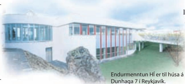
Endurmenntun HÍ er til húsa á Dunhaga 7 í Reykjavík.

Námskeiðið er þrjár eftirmiðdagur og það hefst 10. apríl. Skráning er á endurmenntun.is og skráningarfrestur er til 3. apríl.