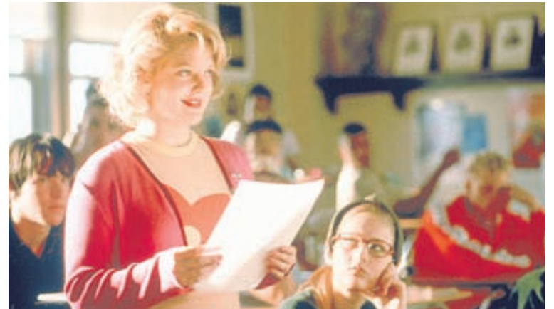
Drew Barrymore reynir að lagfæra það sem miður fór þegar hún gekk fyrst í menntaskóla. Hún reynir að vingast við „svölu krakkana“ en það fer að sjálfsgöðu ekki vel. Hún fellur einnig fyrir enskukennaranum sem flækir málin.