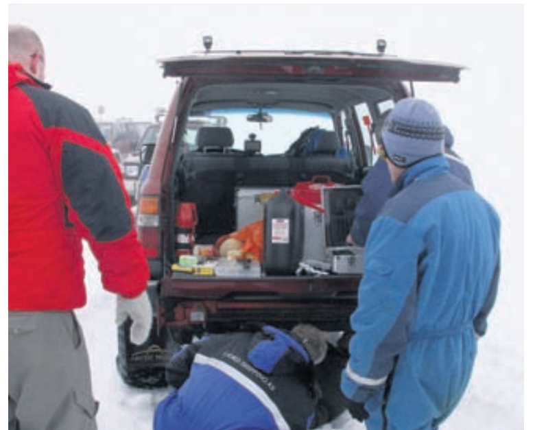
Sé réttur útbúnaður í bílnum er hægt að hafast þar við í nokkurn tíma ef eitthvað kemur fyrir.

Og talandi um börnin, teffist ferðalagið vegna veðurs eða annarra óvæntra atvika er gott að geta gripið í sögubók, geisladisk, kvikmynd eða þrautabók. Slíkt styttr