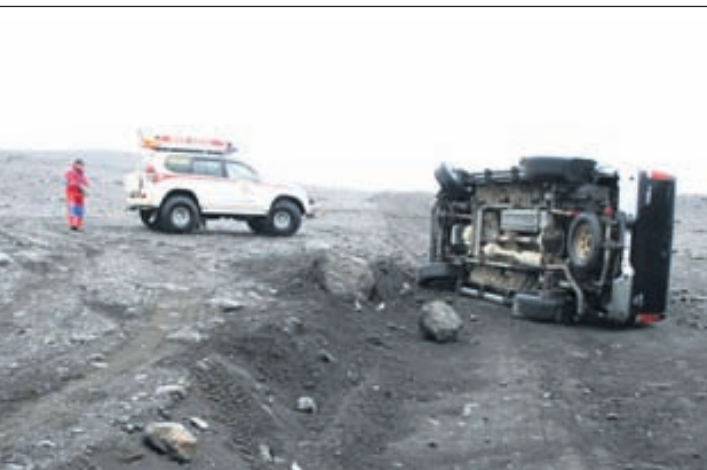
Þegar ferðast er á dýrum tækjum skipta réttar tryggingar miklu máli.

● EKKI AKA UTANVEGAR Vorið nálgast – snjórinn bráðnar og upp koma aðstæður þar sem náttúran er viðkvæmari en oft áður. Utanvegaakstur er ekki eingöngu lögbrot heldur ber hann vott um dómgreindarleysi þess sem hann framkvæmir. Á þessum árstíma þarf að fara sérstaklega varlega þar sem snjór er víða farinn að taka sig upp og því auð jörð inni á milli – jafnvel á okkar akstursleið. Utanvegaakstur getur því valdið enn meiri spjöllum á þessum árstíma og dæmi er um tjón sem hefur tekið áratugi að bæta. Höfum bara okkar á hreinu – ökum aldrei utan vega.