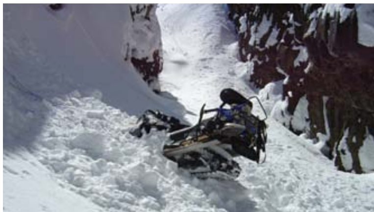
Sleðinn stakkst niður á botn gjárinnar svo verr hefði getað farið.