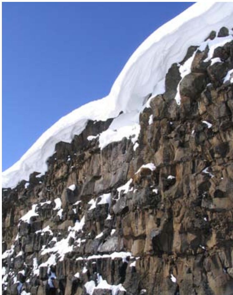
Hjálmar var á milli 20 til 30 kílómetra hraða þegar hann ók fram af brúninni. Klettaveggurinn er 15,5 metra hárf eða eins og fimm hæða hús.