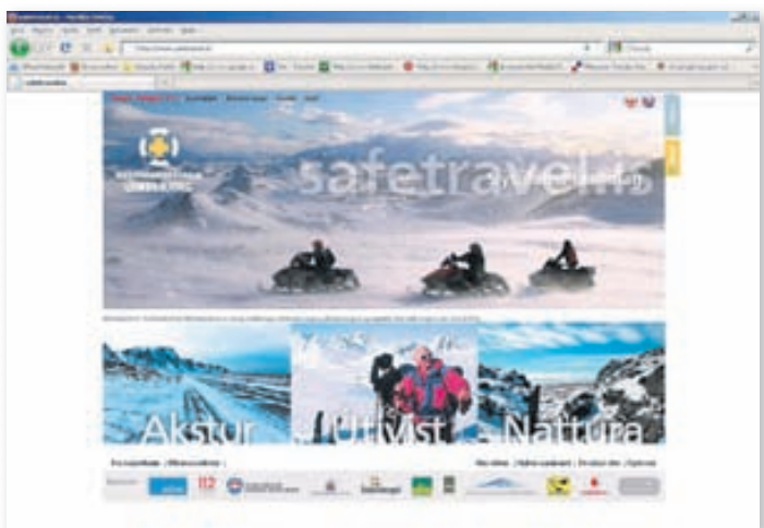
Heimsókn á safetravel.is ætti ávallt að vera fyrsti áfangastaðurinn.

„Kortin eru ómissandi í jöklaferðir, auka öryggi ferðafólks og gefa fleirum færi á að ferðast á jökla. Þau sýna hættulegustu svæðin sem forðast skal áður en lagt er af stað og vísa einnig á hættur ef fara þarf ofan af jökli í óveðrum. Ásamt því gætu jöklaferðir minnkad leitarsvæði björgunarsveita um hundruð ferkílómetra, því með jöklaferðir á GPS-tæki getur jöklaferi staðsett sig nærri þekktum leiðarpunkti og sneitt hjá hættulegum svæðum.“