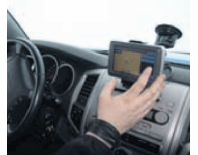
Vegakort eða GPS tæki er nauðsynlegur útbúnaður.

biðina og léttir lund allra í bílnum. Öryggisins vegna á alltaf að tryggja að farangurinn sé festur með neti eða á annan hátt svo hann fari ekki af stað og valdi slysum á þeim sem í bílnum eru. Helstu aukahluti er svo gott að hafa um borð s.s. viftureim, öryggi, olíu, verkfæri, tjakk, tappasett og loftdælu. Góð sjúkrataska á alltaf að vera í bílnum og nauðsynlegt að kanna/endurnýja innihald hennar reglulega.