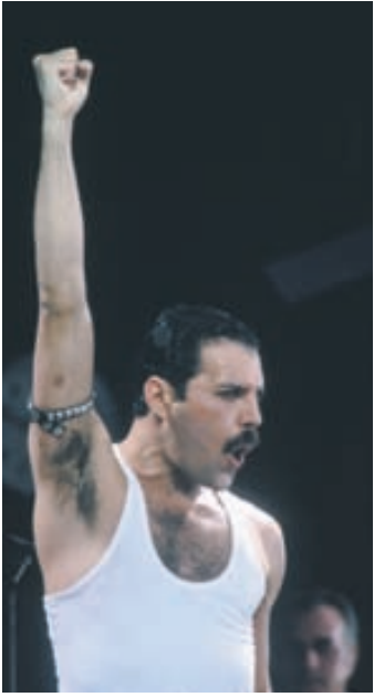
Í myndvandi við lagið I Want to Break Free bregður Freddy Mercury sér í hlutverk konu sem vill brjótast út úr hlutverki þjakaðrar húsmóður.