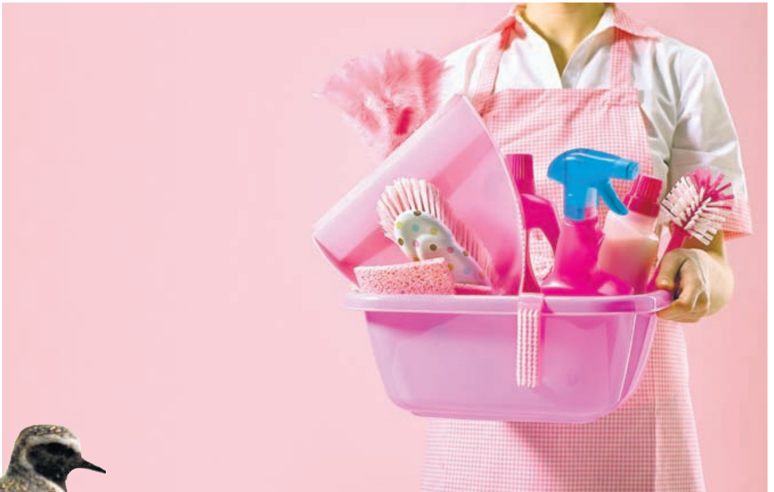
Vorhreingerning er skemmtileg því heimilið fær á sig nýjan og ferskan blæ, og um að gera að leyfa feegurðarskyninu að njóta sín í hreingerningaráhöldunum líka.

gætið að sápu- notkun gagnvart viðkvæmum efnum. Ryksugið húsgögn vel áður en sessur og púðar eru sett á sinn stað.