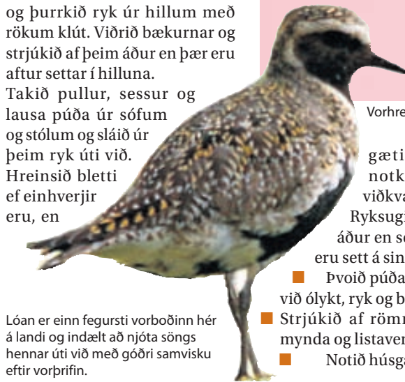
Lóan er einn fegursti vorboðinn hér á landi og indælt að njóta söngs hennar úti við með góðri samvisku eftir vorþriffin.