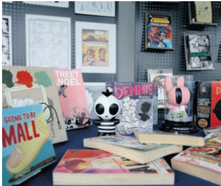
Þemaskiptir básar með áhugaverðum bókum verða á bókamessunni.