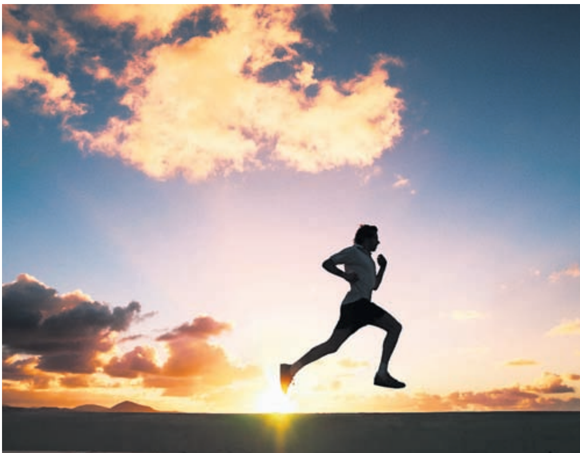
Það getur verið gott að breyta reglulega um hlaupaleið til að fá ekki leið á hlaupunum.