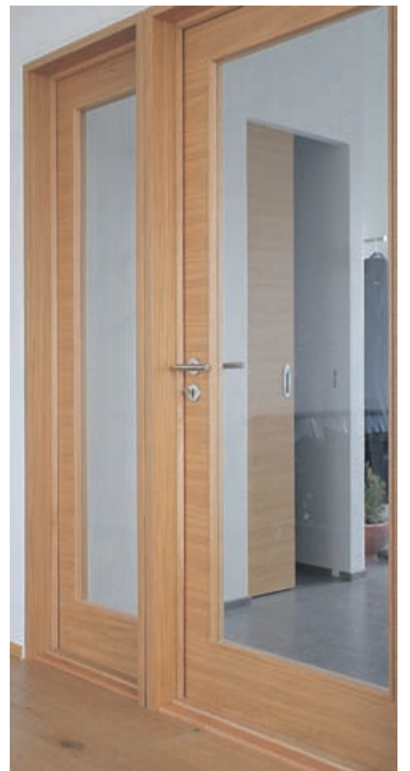
Trévík sérhæfir sig í framleiðslu innihurða. Hér má sjá dæmi um smíði frá fyrirtækinu.

Hægt er að kynna sér starfsemi fyrirtækisins í síma 487-1222 og á heimasíðu þess sem er í vinnslu. Slóðin er trevik.is . Einnig er hægt að senda fyrirspurnir á trevik@trevik.is .