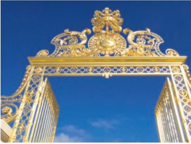
Gullna hliðið að konungshöllinni í Versölum í Frakklandi