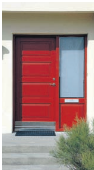
Hurð úr Oregon Pine – rauðmáluð.