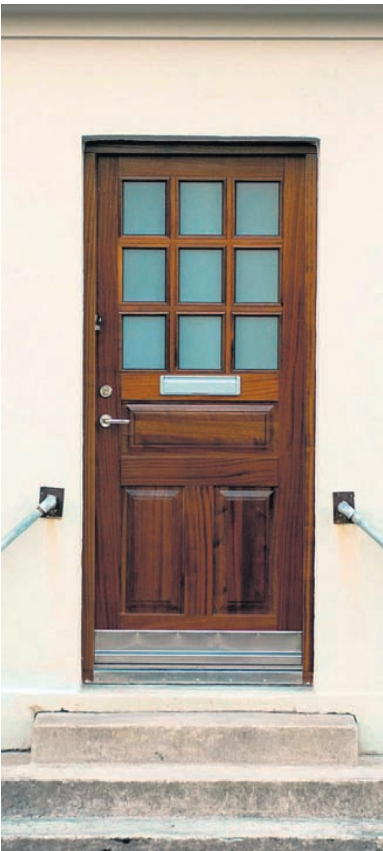
Gæðin út í gegn. Maghony-viður er mikið notaður í framleiðslu SB.

síðri en hurðirnar. Sérfræðingar SB bjóða einnig upp á tvöfalda þéttingu á gluggum og hurðum, meti húsráðendur veðurfar á staðnum líklegt til leiðinda. Eins er glerjað og málað eftir óskum.