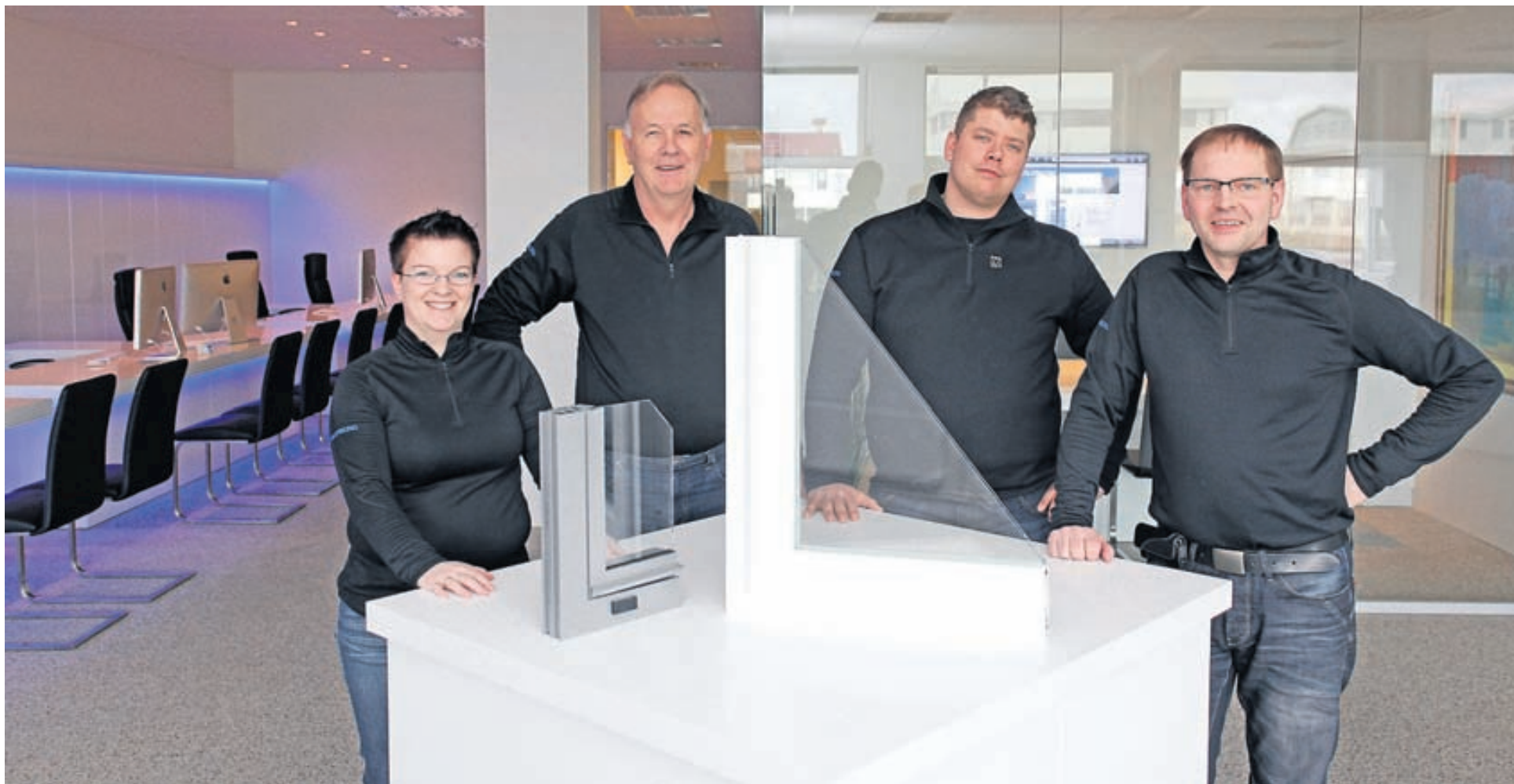
Sölumenn Glerborgar í nýja sýningarsalnum. Fyrirtækið fagnar 40 ára afmæli sínu um þessar mundir og hefur opnað nýjan sýningarsal af því tilefni.