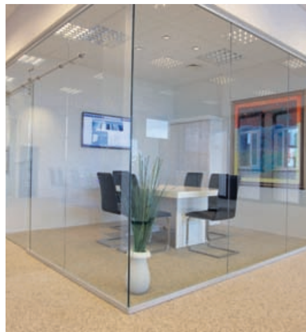
Glerborg býður upp á innihurðir úr hertu gleri sem eru tilvaldar í fundarherbergi, opnar skrifstofur með möguleika á að loka að sér, í sturtur og alls staðar þar sem loka þarf á hljóð en ekki útsýni.

Glerborg býður upp á ótal útfærslur í útliti og búnaði með innihurðum úr hertu gleri. Þessar hurðir eru fánlegar sem rennihurðir og sveifluhurðir sem dæmi og henta vel þar sem leitast er við að hafa gott og opið rými bæði heima fyrir og hjá fyrirtækjum. Dæmi um notkun er í fundarherbergjum, opnum skrifstofum með möguleika á að loka að sér, í sturtur og í raun alls staðar þar sem loka þarf á hljóð en ekki útsýni.