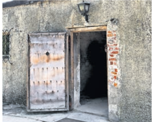
Opin hurð inn í gasklefa í Auschwitz.