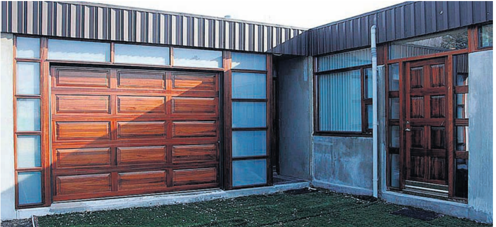
Allt í stíl á góðum díl.