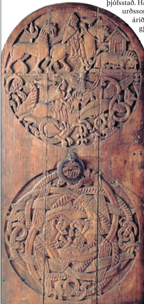
Valbjófsstaðahurðin er einn af lykilgripum Þjóðminjasafns Íslands og er til sýnis á grunnsýningu safnsins „Þjóð verður til – menning og samfélag í 1200 ár.“