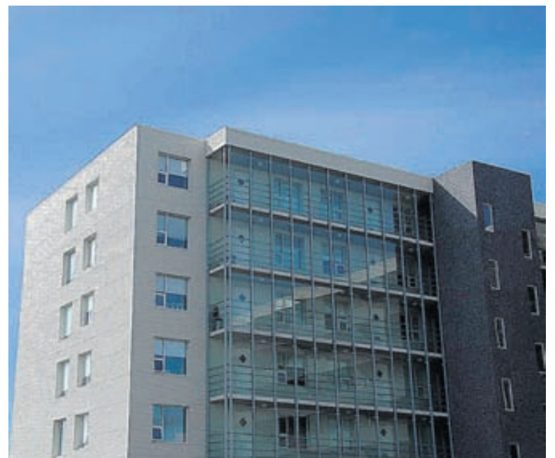
Hellingur af hurðum, allar frá SB.