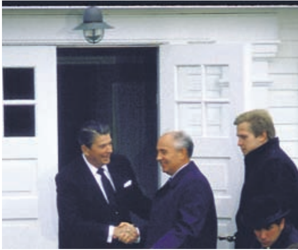
Ronald Reagan og Mikhail Gorbatsjov heilsast við dyr Höfða.