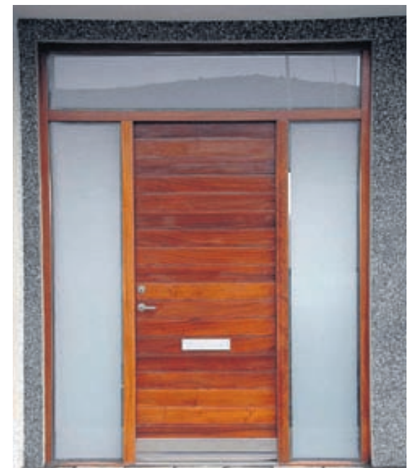
Smekkleig hönnun. Hurðin er úr Maghony-viði, olíuborin.

Þar sem eru hurðir, eru vanalega gluggar. Og þá framleiðir SB líka af kostgæfni. Notast er við furu eða harðvið, enda þykja gluggarnir frá SB fráleitt