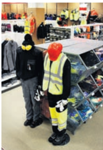
Í verslun N1 á Bíldshöfða er stærsta vinnufatabúð landsins með vinnufatnað, öryggisfatnað, einkennisfatnað og margt fleira.

„Við bjóðum upp á allan alhliða vinnufatnað, meðal annars margar gerðir af buxum, peysum, innanundirfatnað, kulda- og regn- fatnað. Einnig bjóðum við mikið úrval af öryggisvörum eins og skóm, hjálmum, öryggisgleraugum, heyrnahlífum, eyrna- töppum, rykgrímum, hönskum og mörgu fleira,“ segir hann.