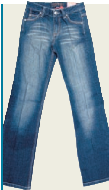
Gallabuxur voru vinnufatnaður ítalskra bænda og bandarískra náma- verkamanna á nítjándu öld.