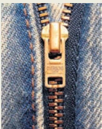
Rennilásinn eins og við þekkjum hann í dag var fundinn upp árið 1913.

Gallabuxur eiga uppruna sinn að rekja til ítalska bæjarins Genúa, en þar var snemma á nítjándu öld framleitt bómullar- efni í segl. Vegna þess hve efnið reyndist slitsterkt var markaður úr því vinnufatnaður fyrir bændur. Elstu gallabuxur sem varðveist hafa eru frá árinu 1860 af Guisepe Garibaldi. Efnið slitsterka fluttist út til Evrópu með sjómönnum frá Genúa og reyndu franskir vefarar að búa til eins efni. Það tókst þó ekki en við þær tilraunir varð samt til svipað efni, „de Nimes“ eða denim. Gallabuxurnar breidd- ust svo út til Ameríku seint á nítjándu öld en Levi Strauss seldi þá meðal annarra gallabuxur til námuverkamanna í Banda- ríkjunum. Heimild: Wikipedia.org