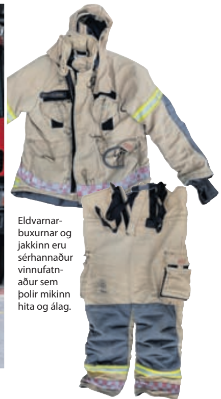
Eldvarnarbuxurnar og jakkinn eru sérhannaður vinnufatnaður sem þolir mikinn hita og álag.