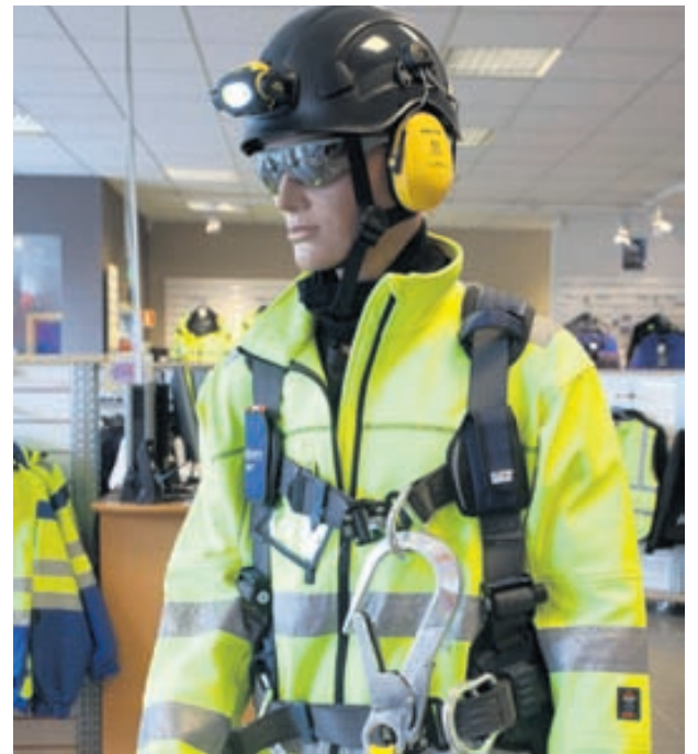
Hjá Dynjanda fæst einnig mikið úrval af öryggisbúnaði og öryggisskóm.