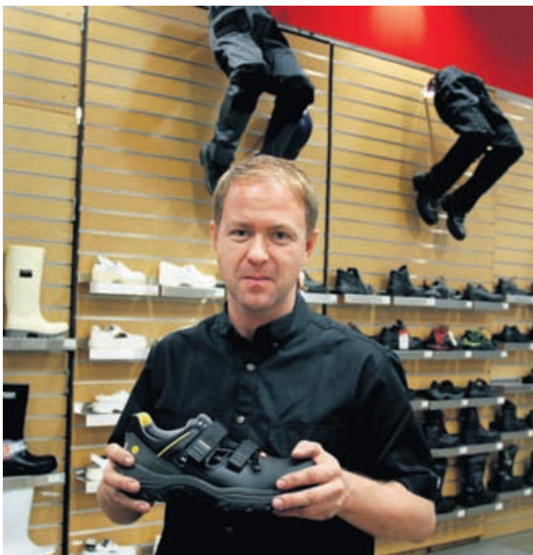
Hjá N1 er hægt að fá mikið úrval af öryggisskóm en þá er hægt að velja skó með stáltá, áltá eða fibertá.