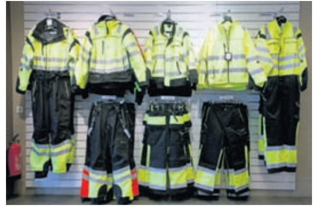
Mikið úrval öryggisfatnaðar með endurskini.