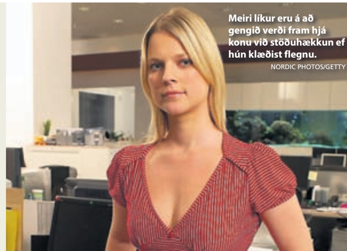
Meiri líkur eru á að gengið verði fram hjá konu við stöðuhækkun ef hún klæðist flegnu.

Þannig að ef konur vilja komast áfram á vinnustaðnum ættu þær að geyma flegnu bolina heima á meðan þær eru í vinnunni og nota þá heldur við aðrar aðstæður.