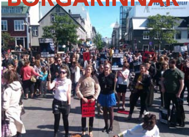
Nei-hópurinn á druslugöngu í Reykjavík 2011.

Fyrsta druslugangan fór fram í apríl 2011 í Toronto í Kanada. Mótmælendur skipulögðu gönguna eftir að lögregluþjónn ávarpaði nemendur við York-háskóla þar í borg og sagði að konur ættu að forðast að klæða sig eins og druslur, svo ekki yrði ráðist á þær.