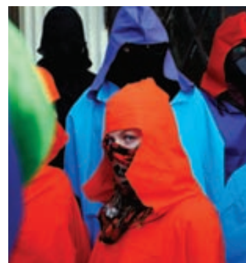
„Lögregla skal hvenær sem þess er þörf hefja rannsókn út af vitneskju eða grun um að refsivert brot hafi verið framið hvort sem henni hefur borist kæra eða ekki.“

„Skilaboðin sem verið er að senda eru þau að það þurfi að vernda vændiskaup- endur fyrir geðveikri vændislöggjöf,“ segir Þorbjörg Inga.