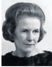
Óhætt er að segja að Auður Auðuns hafi lagt línurnar fyrir jafnrétti á Íslandi.