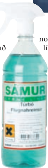
Túrbó flugnahreinsirinn frá Sámi er nýkominn á markað. Hann er einfaldur í notkun og virkar vel.

Olís, N1 og Europris selja Sáms Túrbó flugnahreinsinn ásamt öðrum hreinsivörum frá Sámi.