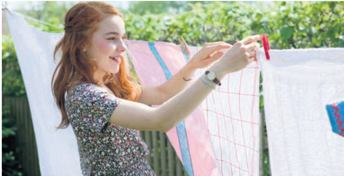
Á sumrin er dásamlegt að hengja þvott út til þerris í brakandi þurrki og yndislegri gróðurangan.