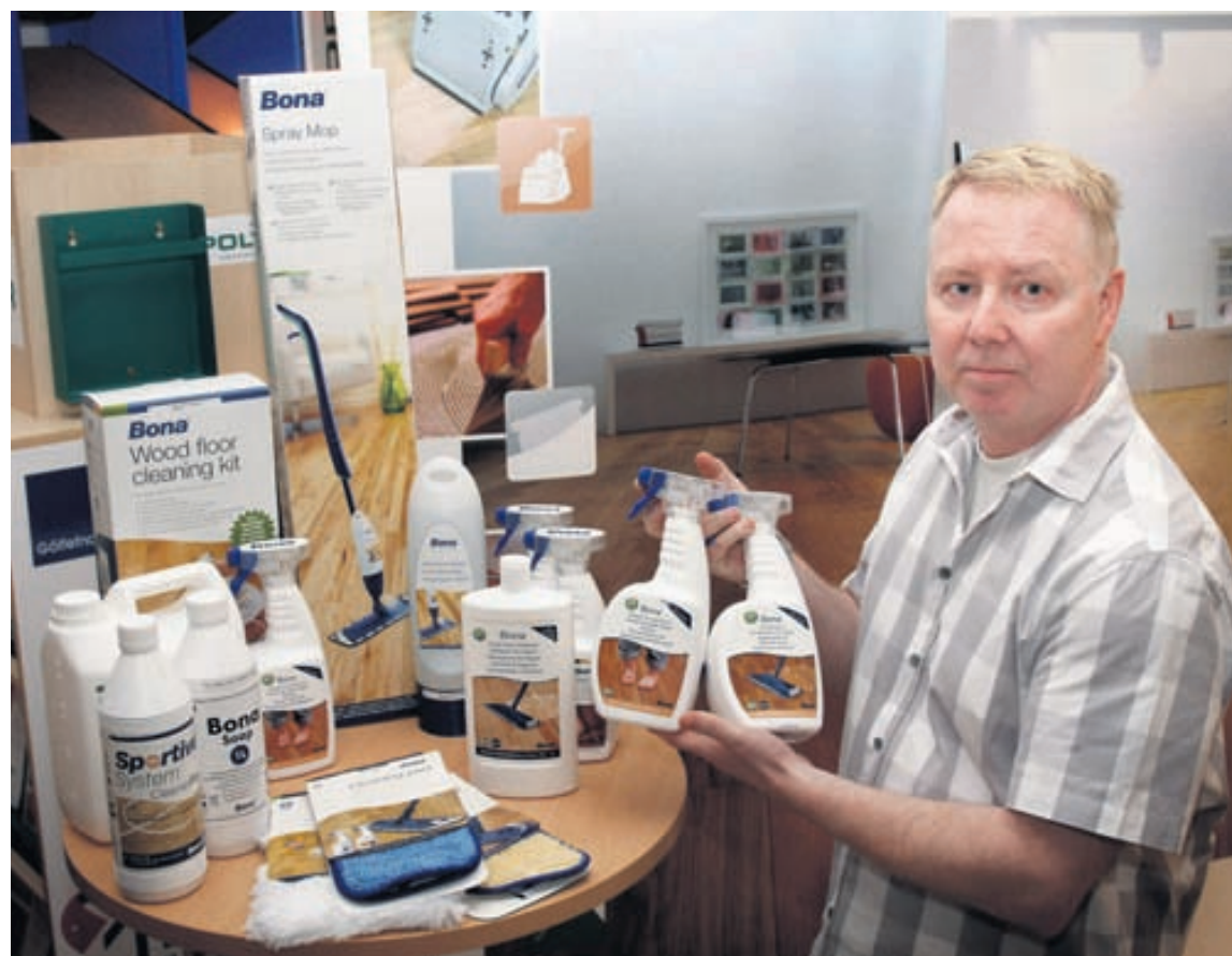
Gólfefnaval flytur inn viðhaldsvörur fyrir allar gerðir af parketi frá Bona í Svíþjóð. Bona er einn stærsti framleiðandi umhverfisvænna viðhaldsefna fyrir parket í heimi.

Í samvinnu við Iðjuna fræðslusetur og Félag íslenskra parketmanna hefur Gólfefnaval boðið upp á fjölda námskeiða fyrir fagmenn. „Við förum í fyrirtæki og heimahús og metum ástand parkets og leggjum síðan til hvað hægt er að gera