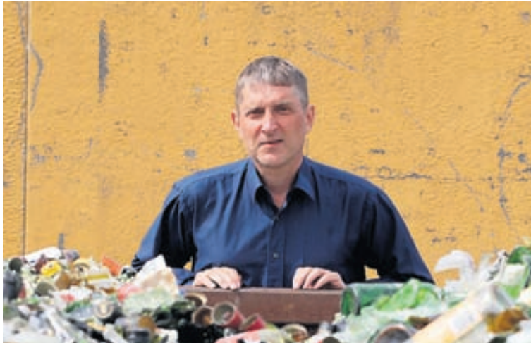
Gler er meðal annars notað í landfyllingu umhverfis sorphauga Sorpu, í undirlag þjóðvega, sem íblöndunarefni í malbik og sem gólfefni.

„Ég spurði mig af hverju ekki væri verið að endurvinnna gler á Íslandi. Magnið sem til fellur er í kringum 3500 tonn á ári. Það er hins vegar of lítið til að það borgi sig að reisa endurvinnsluverksmiðju. Ég setti mig í samband við ýmsar endurvinnslustöðvar en þær greiða yfirleitt ekki neitt fyrir efnið vegna þess að það er ekki nógu hreint og óflokkað. Það er gríðarlega kostnaðarsamt að flokka og