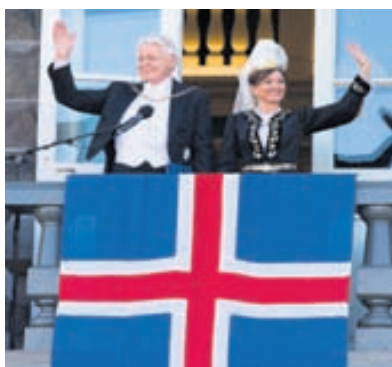
Dorrit Moussaieff var glæsileg að vanda