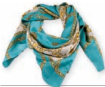
Satin klútur með keðju og blómaskreyttu mynstri 1.995,- kr