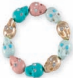
Armband með hauskúpum 1.595,- kr