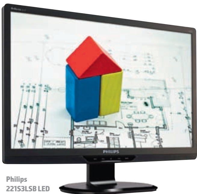
Philips 221S3LSB LED