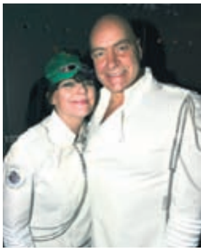
Stuðmenn á Nasa.