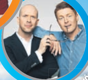
SIMMI OG JÓI