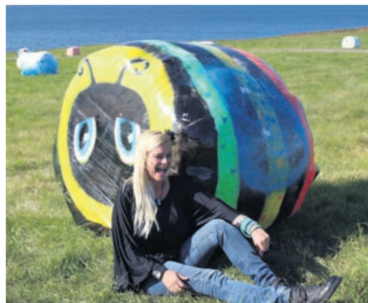
Heyrúllurnar munu standa í túninu í Eyrarkoti fram að verslunarmannahelgi og geta áhugasamir því kíkt í Kjósina og borið þær augum þangað til.