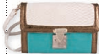
Marglitað veski með langri ól 3.395,- kr