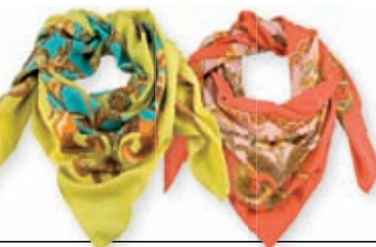
Ofin sjöl með barokk skraut mynstri 1.995,- kr