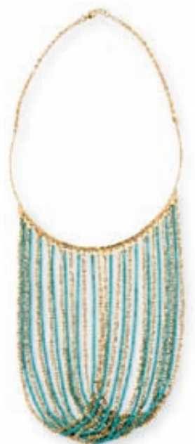
Hálsfesti með keðjum 2.595,- kr