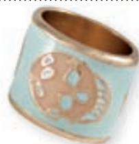
Hringur með hauskúpumynstri 995,- kr