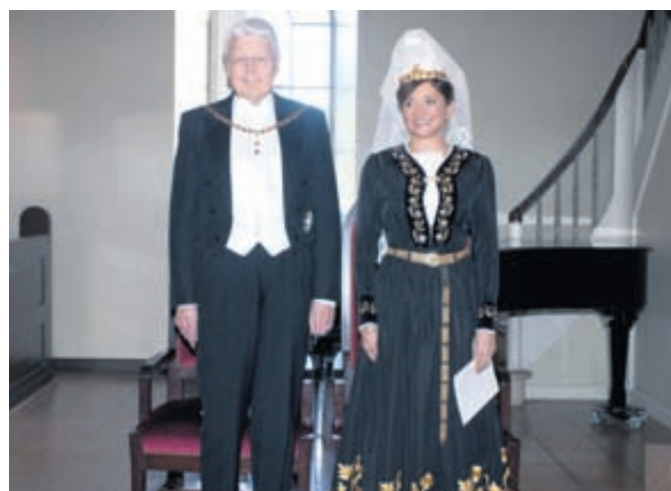
Frá innsetningu forseta fyrr í vikunni.

Dorrit Moussaieff forsetafrú var að vanda glæsileg þegar eiginmaður hennar, Ólafur Ragnar Grímsson, var settur í embætti forseta í fimmta sinn á miðvikudaginn. Dorrit klæddist íslenskum skautbúningi, en samkvæmt upplýsingum frá forsetaembættinu var hann saumaður árið 1938 og er því sjötíu og fjögurra ára gamall. Brjóstnælan á búningnum er gömul víravirkisnæla sem Ólafur Ragnar gaf Dorrit. Fjöldi fólks var viðstaddur embættis-tökuna og óskaði forsetahjónunum til hamingju. Á meðal þeirra voru Vigdís Finnbogadóttir, fyrrverandi forseti Íslands, Jóhanna Sigurðardóttir forsætisráðherra, Ásta Ragnheiður Jóhannesdóttir, forseti Alþingis, og Agnes Sigurðardóttir, biskup Íslands.