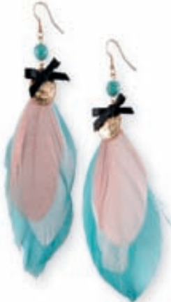
Fjadræyrnalokkar með málmbauskúpum 1.395,- kr