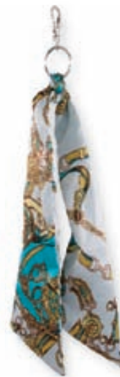
Lyklakippa með klút 1.195,- kr