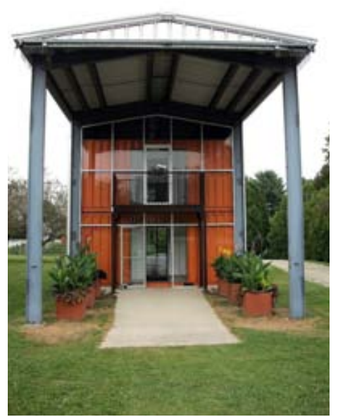
Hér hefur verið byggður glæsilegur inngangur að gámahúsi á tveimur hæðum.