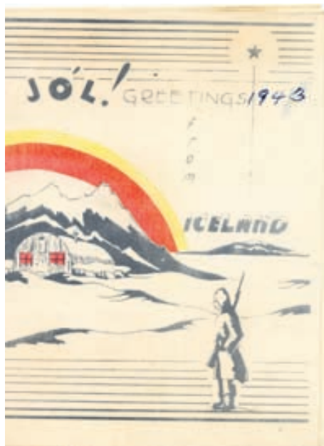
Jólaort frá árinu 1943.

Einstaka deildir bandaríska hersins hér á landi létu auk þess framleiða eigin jólaort merkt viðkomandi deildum. „Verkfræðideild sjóhersins var til dæmis með kort merkt „Seabees“ og svo mætti lengi telja. Þessi jólaort voru einungis gerð fyrir hverja deild fyrir sig sem störfuðu hér á landi á þessum árum. Það sést vel á sumum kortunum að þau eru framleidd hér á landi. Á einu þeirra er ein þýðing-