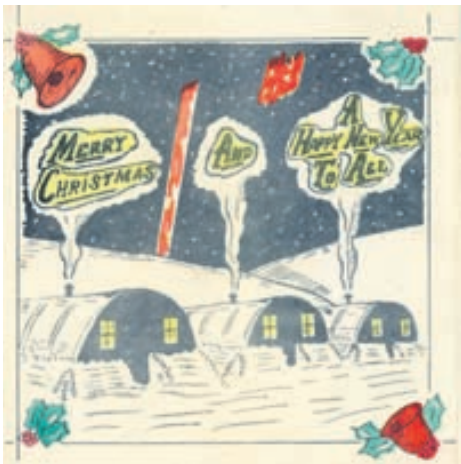
Braggjól á Íslandi.

Íslensku jólaortin voru teiknuð af Stefáni Jónssyni, listamanni úr Hafnarfirði, en voru ekki merkt honum. Þau eru 23 talsins og spanna nokkurra ára tímabil. Þannig eru elstu kortin með myndum af breskum hermönnum. Næst í röðinni eru kort með bæði breskum og bandarískum hermönnum og yngstu kortin eru með bandarískum hermönnum enda þeir bresku þá farnir hér af landi.