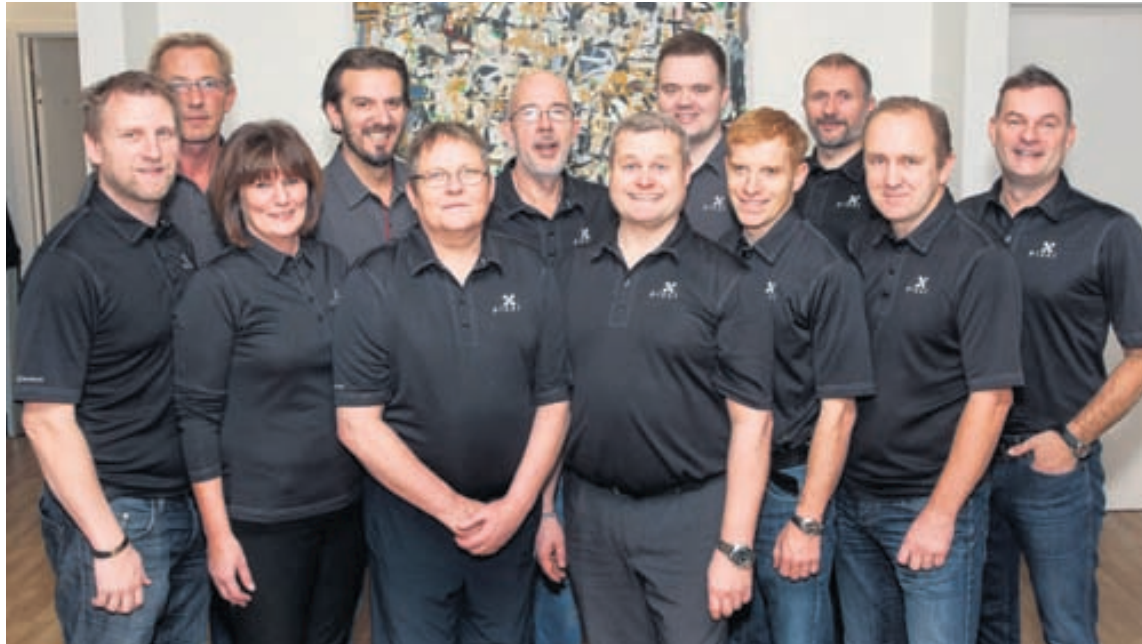
Öflugur hópur starfsmanna Pixel prentþjónustu er kominn í jólaskapið og tilbúinn fyrir jólaösina.

„Umslög fylgja öllum jólakortum og við bjóðum einnig upp á umslög árituð með nafni. Þá er hægt að senda okkur nafnalistann í Excel-skjali í tölvupósti og við prentum utan á umslöginn nafn viðtakanda og heimilisfang. Þá þarf ekkert að gera nema smella kortunum í umslag og drífa í póst.“