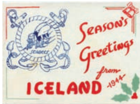
Jólaort frá „Seabees“ frá árinu 1944.