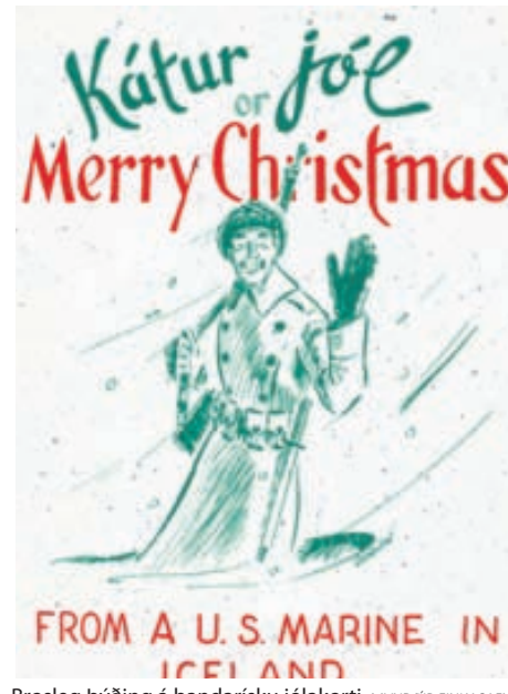
Brosleg þýðing á bandarísku jólaorti.

Auk jólaortanna á Sævar gott safn af öðrum munum frá stríðstímanum. Hann á til dæmis safn skrautvasaklúta úr silki sem seldir voru breskum og bandarískum hermönnum sem sendu þá heim til ástvina sinna. Einnig á hann matseðla og ýmsa smámunni sem hermennirnir gerðu á meðan þeir dvöldu hér.