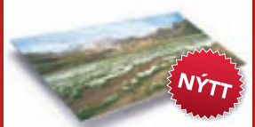
Ljósmyndir á álplötu