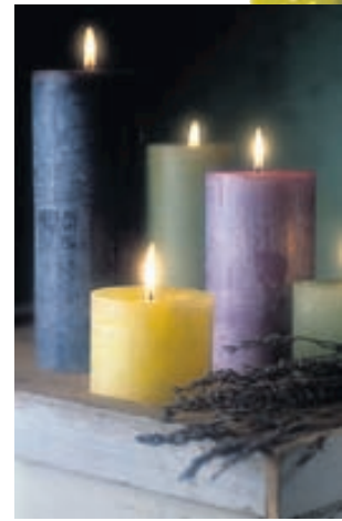
Kerti fást í úrvali á þessum árstíma og flestir hafa not fyrir þau. Þá má velja saman fallega liti og búa til alls kyns skreytingar. Víða er líka að finna ilmkeri sem gefa dásamlegan húsilm; jafnvel epla-, kanil- og piparkökuilm.

Glerkrukkur fást í ýmsum stærðum og gerðum í húsgagna- og smáhlutaverzlunum og þurfa ekki að kosta mikið. Þær eru margar á fæti með loki og virkilega smart. Þær má fylla með heimagerðum smákökum, karamellum eða öðru sniðugu. Þegar innihaldið er búið stendur eftir eiguleg krukka undir ýmislegt smálegt.