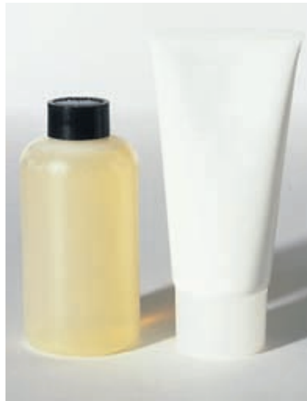
Krem og sturtusápa er klassísk gjöf fyrir konur jafnt sem karla og kemur alltaf að notum.

Ólíur og edik koma sér alltaf vel og fást oft í fallegum flöskum sem gott er að pakka inn í sellófan og láta fallega orðsendingu og jafnvel ljóðbrot fylgja.