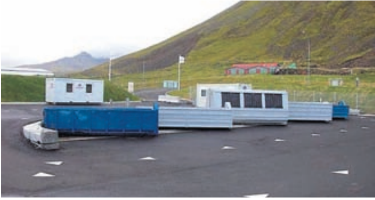
Frá Gámavellinum Enni í Snæfellsbæ.