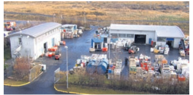
Starfsstöð Efnamóttökunnar í Gufunesi.

Móttaka og meðhöndlun raftækja er núna stór þáttur í starfsemi félagsins. Það tók virkan þátt í innleiðingu nýs kerfis og er aðal- söfnunaraðili notaðra raftækja á