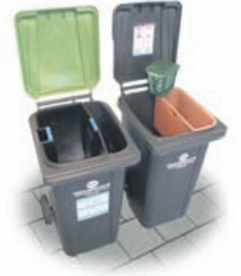
Dalvíkurlausnin, tvær tunnur og tvö hólf.