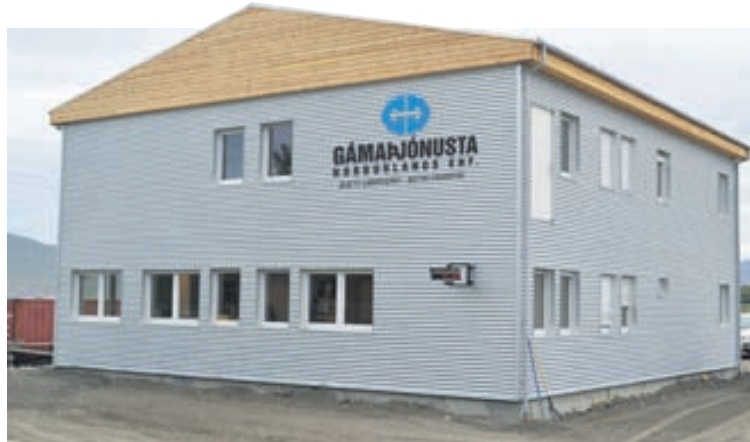
Nýjar höfuðstöðvar Gámapjónustu Norðurlands.