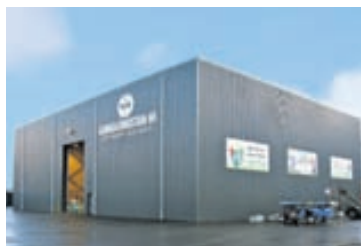
Flokkunarstöð Gámaþjónustunnar að Berghellu, Hafnarfirði.

Endurvinnslutunnan er losuð í Berghellu. Hvernig gengur að flokka