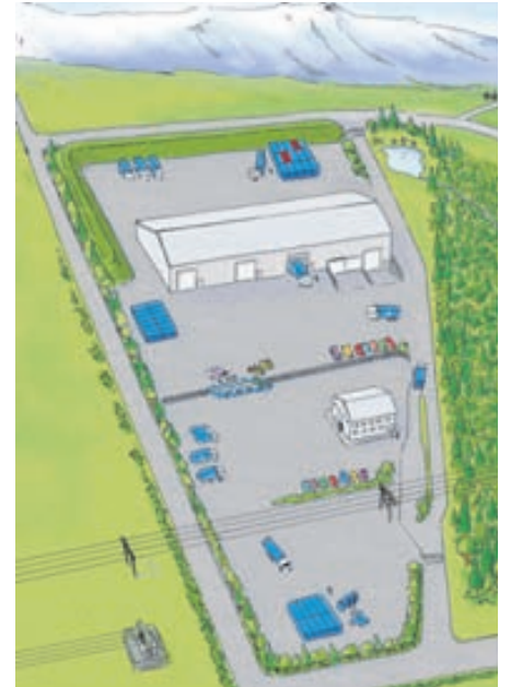
Hlíðarvellir, athafnasvæði Gámapjónustu Norðurlands.