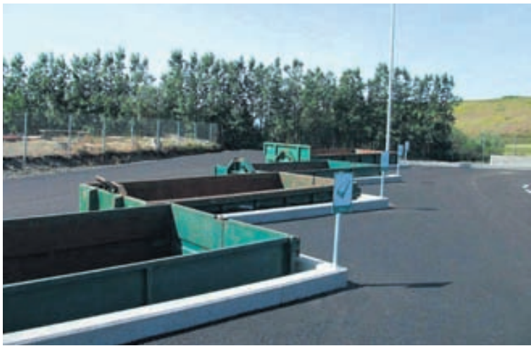
Gámavöllur á Blönduósi.

SVH annast stíflubjónustu á svæðinu með sérútbúnum tækjum og einnig er fyrirtækið með ýmiss konar jarðvinnu- og akstursþjónustu.