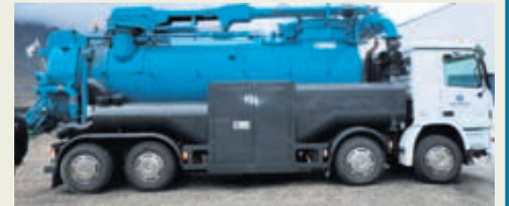
Sérhæfur ryksugubíll hjá Gámaþjónustu Austurlands.

Árið 2010 fóru aðeins 0,3% af úrgangi Alcoa Fjarðaáls til urðunar.