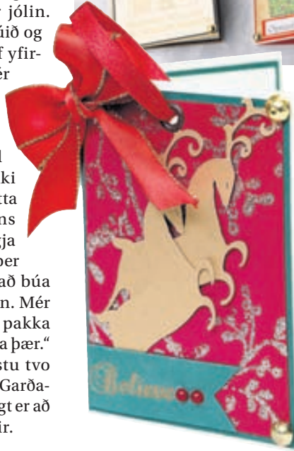
Ragnhildur leggur mikla vinnu í kortin og er hvert og eitt einstakt.