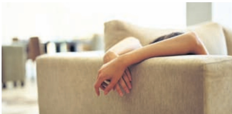
Gjafabréf upp á algjöran frið í hálf tíma myndi gleðja mömmu og pabba.