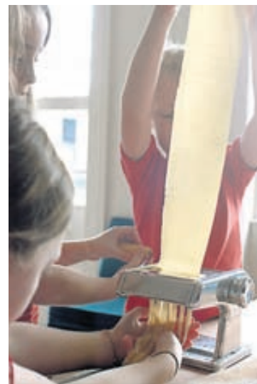
Gjafabréf á eina máltíð og frágang á eftir er sniðugt. Passið bara að bjóða upp á máltíð sem þið treystið ykkur til að elda.