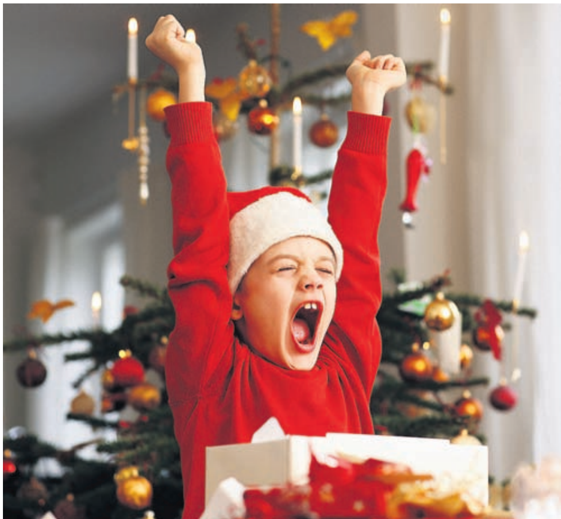
Mikið kapp getur skapast í pakkaleikjum sem verður til þess að lífga upp á veisluna.