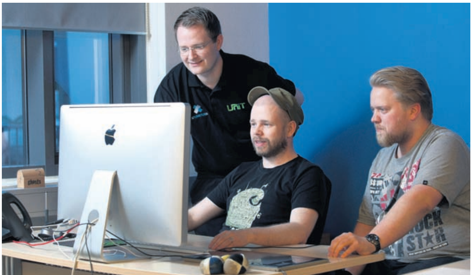
Nethönnun sérhæfir sig í skipulagningu, viðhaldi og uppsetningu tölvukerfa og tæknilegri aðstoð við tölvudeildir. Þar er lögð áhersla á persónulega þjónustu.