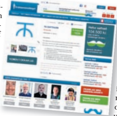
WebMaster keyrir einnig áheita vefi sem vakið hafa mikla athygli eins og mottumars.is.

WebMaster-kerfið býður upp á ýmis viðbótarkerfi eins og póstlistakerfi sem notað er til að senda út markpósta. „Formasmiðurinn er einnig vinsælt viðbótarkerfi sem hægt er að nýta fyrir fyrirspurnir, pantanir, þjónustubeiðni og fleira sem vistast í gagnagrunn