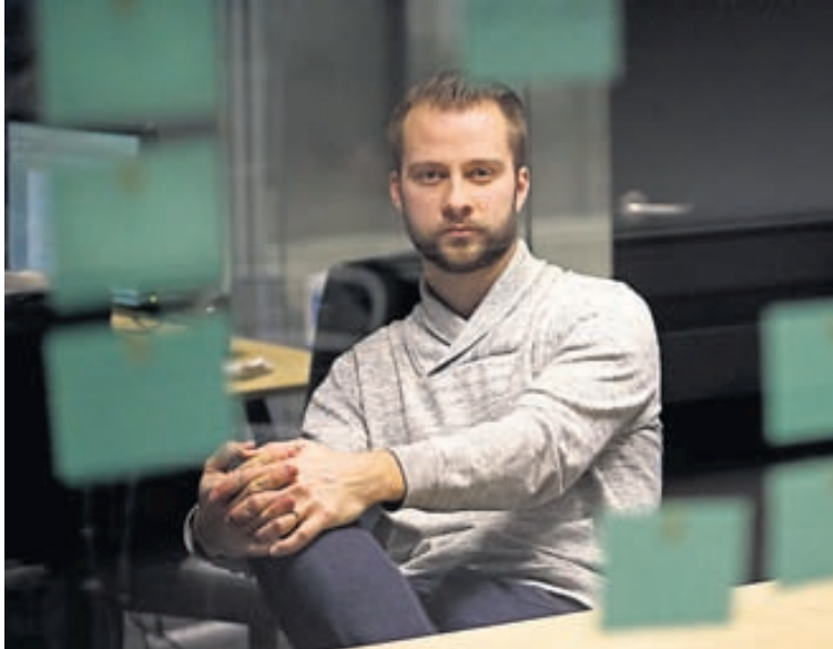
Hjá flestum fyrirtækjum og stofnunum eru samfélagsmiðlar einungis viðbót við heimasíðuna og aðrar samskiptaleiðir.