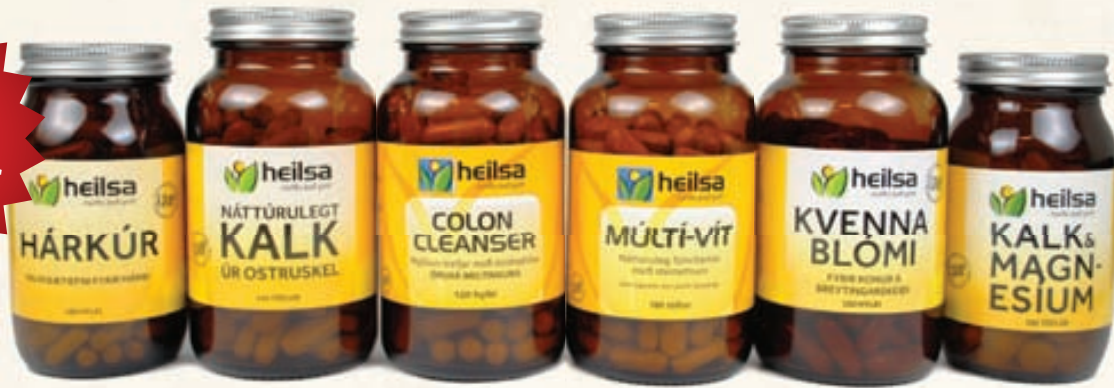
Öll bætiefni með Gula miðanum frá Heilsu