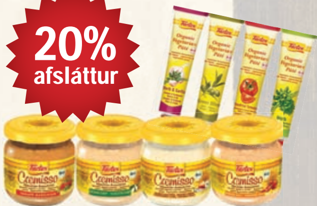
Tartex Gómsætar vörur sem innihalda ríkulegt magn af próteini og hafa lágan sykurstuðul