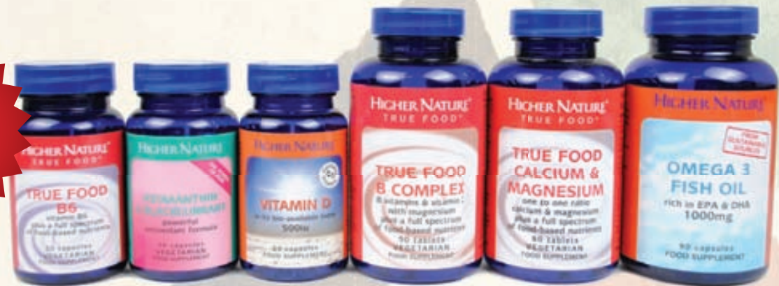
Higher Nature – hágæða vítamín og bætiefni. Fást eingöngu í Heilsuhúsinu