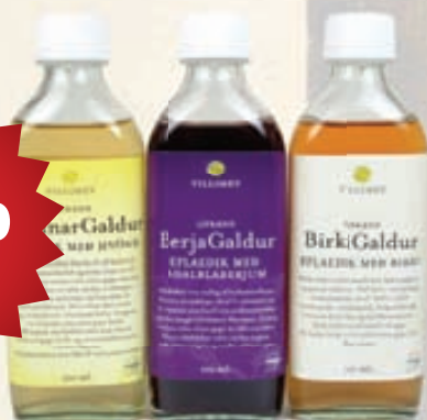
Villimey Nýju galdramir þrjár á 20% kynningartilboði