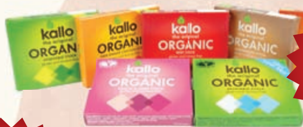
Kallo kraftur í sósur og súpur – lífrænn kraftur