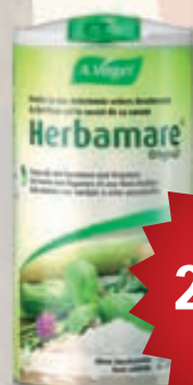
Herbamare Frábært í alla matargerð