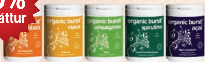
Organic Burst – frábært í boostið