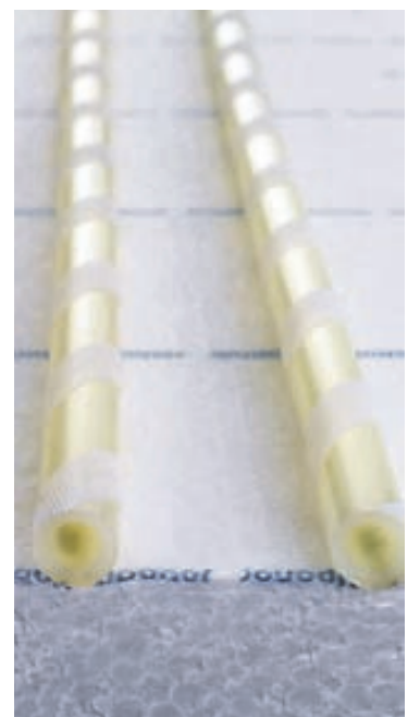
Hefðbundin uppbygging á gólfhitakerfi.