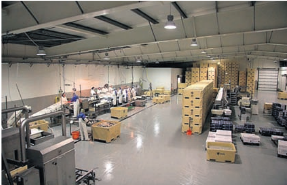
Epoxy Flex er með sérstaka grunna sem þola mikinn raka og henta vel fyrir fiskverkanir og matvælavinnslur. Hér má sjá húsnæði KG fiskverkunar á Rífi þar sem Epoxy Flex lagði gólfefni.