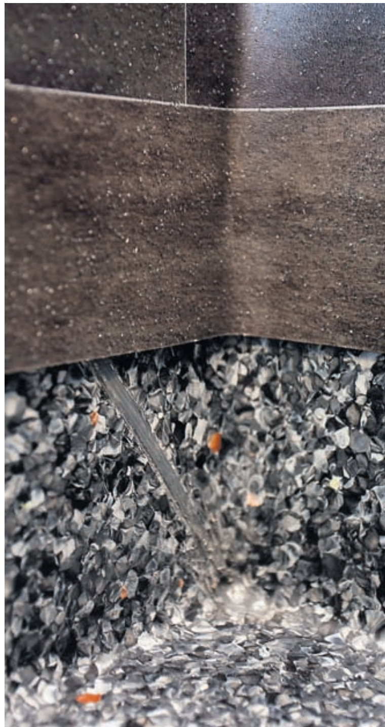
Hér eru veggir og gólf dúkklagðir með vatns- og loftþéttum samskeytum. Allir löggiltir dúkklagningamenn geta annast slík verk. Fjölbreytt úrval vegg- og gólfduka til votrýmislagna fæst hjá Kjaran.