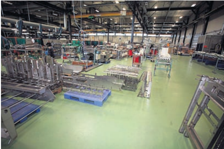
Meðal verkefna sem Epoxy Flex hefur unnið að eru verkstæðisgólfín í húsnæði Marel í Garðabæ.

Kynningarblað Gólfhiti, parket, dúkur, flísar, flotuð gólf, steinteppi, gæði, fagmennska, útsölur