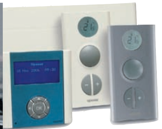
Þráðlausar gólfhitastýringar frá UPONOR.