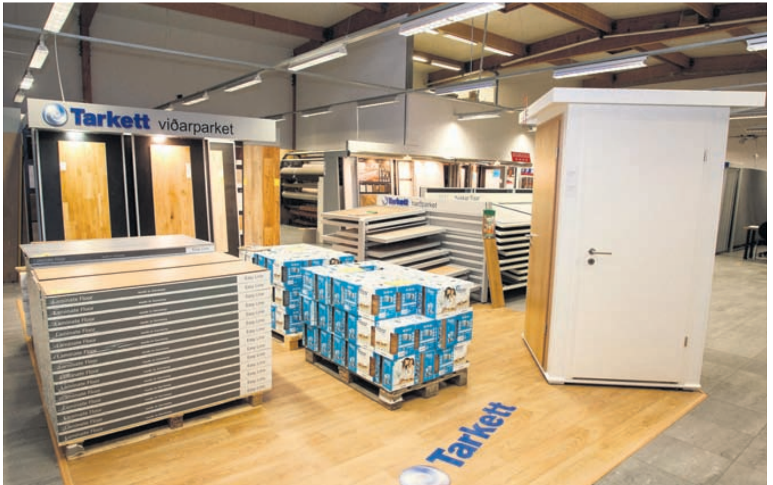
Á útsölnunni eru þúsundir fermetra af flísum á niðursettu verði og afslætti allt að 70 prósentum.

Í versluninni starfar fólk með áratuga reynslu sem veitir ráð við val og niðurlögn á gólfefnum. „Við seljum ekki vinnu við niðurlögn en bendum á fagmenn sem við höfum góða reynslu af. Þegar kemur að stærri verkefnum eins og teppa- og dúkalögn í fjölbýlishúsum eða hjá fyrirtækjum erum