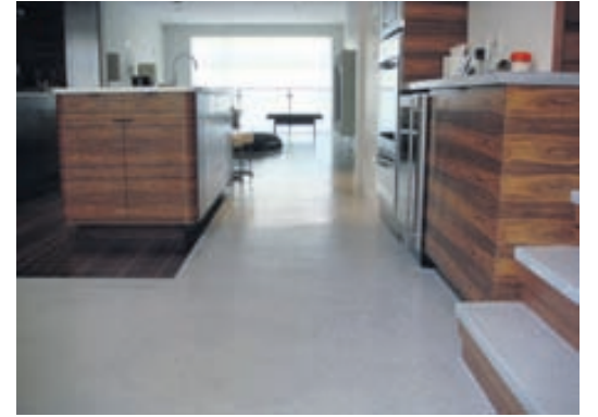
Hér hefur flot verið sett á stóran flöt en dökkt parket er á hluta.

Einnig er hægt að hafa heimilið flotað að hluta en parket og flísar með. Íbúðin getur verið ákaflega smekkleg þótt gólfefnin „vanti“. Ef gólfefnið er ekki nýjum eiganda að skapi við sölu er auðvelt að breyta og setja annað gólfefni yfir.