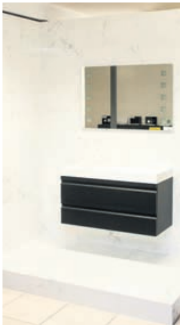
Gæðin eru í fyrirrúmi hjá Álfaborg.

Hann hvetur fólk til að líta við í versluninni að Skútuvogi 6 á meðan útsalan stendur yfir en hún verður út næstu viku. Auk gólfefna er þar að finna allt fyrir baðherbergið; bæði flísar og hreinlætistöki sem og þakrennur og verkfæri. Sjá nánar á www.alfaborg.is .