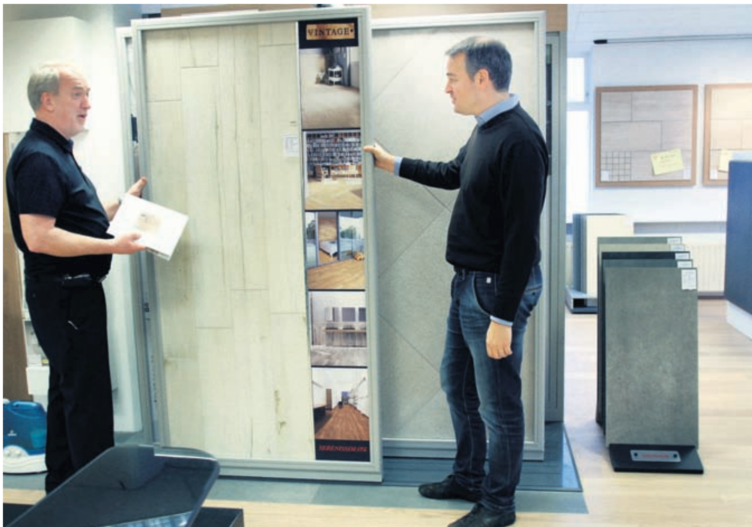
Reynslumiklir starfsmenn verslunarinnar aðstoða viðskiptavini við val á flísum og parketi.

Það skiptir miklu máli að sögn Sigurðar að velja gólfefni frá góðum