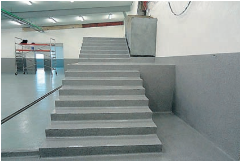
Stigi í Fiskverkun Sófaníasar Cesilssonar.