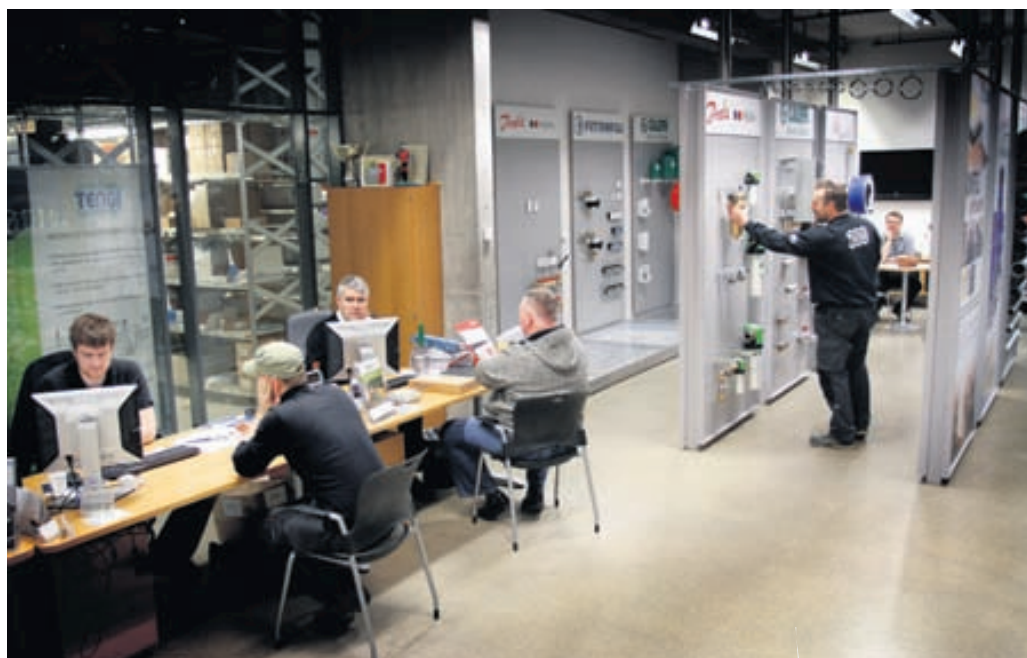
Starfsmenn Tengis hafa áralanga reynslu við ráðgjöf og sölu gólfhitalausna.