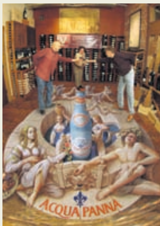
Prívitt listaverk eftir Kurt Wenner.

Dýrsta parket heims er búið til úr Makassar-svartviði sem vex til dæmis á Indlandi og Srí Lanka en þó helst á eyjunni Sulawesi sem tilheyrir Indónesíu. Nafn viðarins er dregið af aðalhöfn eyjunnar sem heitir Makassar. Viðurinn er dökkbrúnn og svartur á lit með appelsínu- og gullituðum röndum sem oftast liggja nokkuð beint eftir viðnum. Viðurinn er sérstaklega þéttur og losnar síður í sundur en annar viður. Það er ekki ókeypis að leggja parket úr slíkum við. Fermetrinn kostar um 200.000 krónur og þar sem hann fæst ekki í verslunum hérlandis bætist flutningskostnaður við verðið hafi einhver áhuga. Viðurinn er einnig notaður í ýmislegt annað, til dæmis í skápa og innréttingar. Japanir notuðu einnig viðinn lengi sem stólpa og stoðir í húsum sínum enda voru þeir lengi vel helstu innflytjendur hans. Það þykir frekar erfitt að vinna með viðinn enda er hann nokkuð brothættur. Þannig þarf að bora í viðinn áður en hann er negldur fastur. Það tekur líka mjög langan tíma að þurrka viðinn eða allt að tvö og hálf ár. Trén sjálf ná um 20 metra hæð við bestu skilyrði en það gerist sjaldan nú á dögum sökum mikillar eftirspurnar.