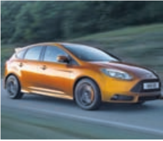
Mikið tap var á rekstri Ford í Evrópu í fyrra.