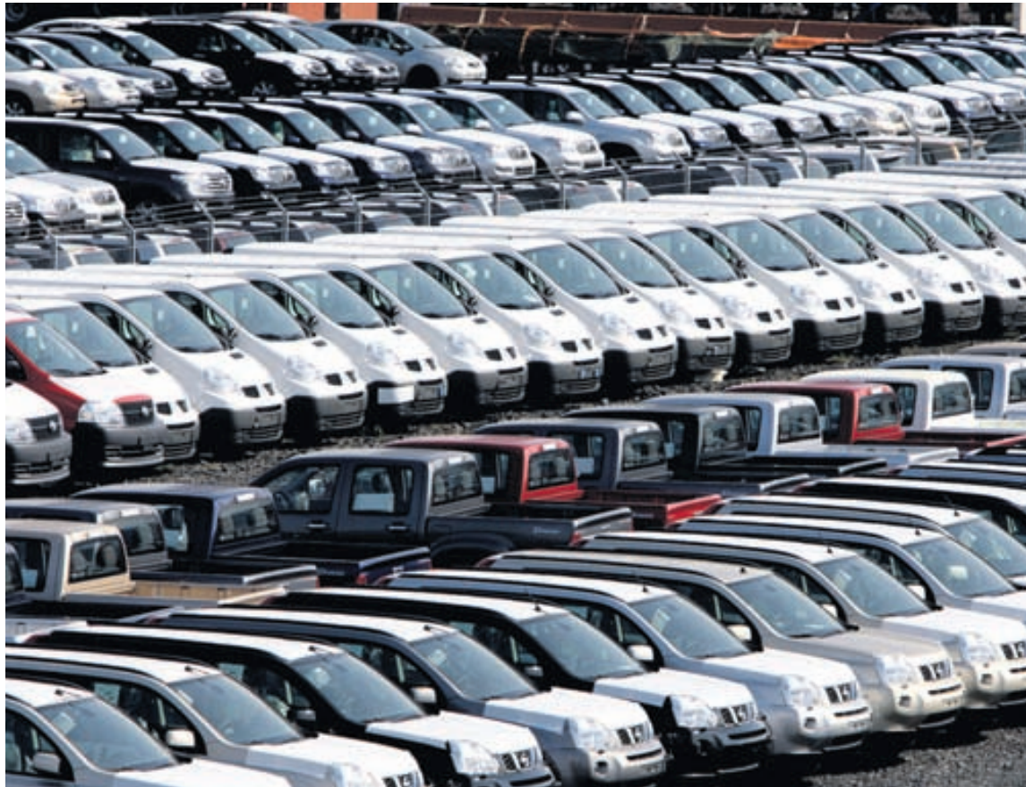
Það tínist hratt af lagerunum vestanhafs en hægar hérlendis.