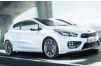
Kraftaleg útfærsla á Kia cee'd.

Þrátt fyrir að Ford hafi tapað miklu á sölu bíla sinna í Evrópu á síðastliðnu ári eru öll teikn á lofti um að fyrirtækið verði mun sneggra að minnka tapið en General Motors. Ford mun að líkindum snúa tapi í núllrekstur eða hagnað árið 2014, en það mun GM ekki takast fyrr en í fyrsta lagi ári seinna. Ford ætlar að bjóða margar gerðir bíla sinna í Evrópu á næstunni sem ekki hafa sést þar víðast hvar áður, eins og Mustang, Edge og EcoSport-jeppling. Stutt er í heildaruppgjör Ford fyrir síðasta ár og verður það mjög gott þrátt fyrir tapreksturinn í Evrópu.