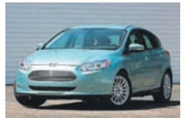
Ford Focus rafmagnsbíllinn

með Leaf-rafmagnsbíl sinn og hefur boðað 18% lækkun á 2013 árgerð hans. Hann mun kosta 28.800 dollara, eða 3,7 milljónir króna. Það er ekki hátt verð fyrir rafmagnsbíl og einsýnt að Nissan græðir ekki mikið á sölu hvers bíls heldur tapar líklega á hverju seldu eintaki.