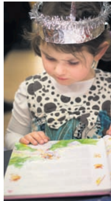
Gerðuberg breytist í gósenland sköpunar og gleði á Heimsdegi barna.

„Heimsdagur barna var upphaflega hátíð þar sem ólík þjóðarbrót sýndu handverk og skemmtun frá gamla heimalandinu. Þetta hefur breyst í tímans rás. Innflytjendur eru oft einangraðir, ekki síst foreldrar barna af erlendum uppruna. Við viljum hvetja þá til að taka þátt með börnum sínum á Heimsdegi