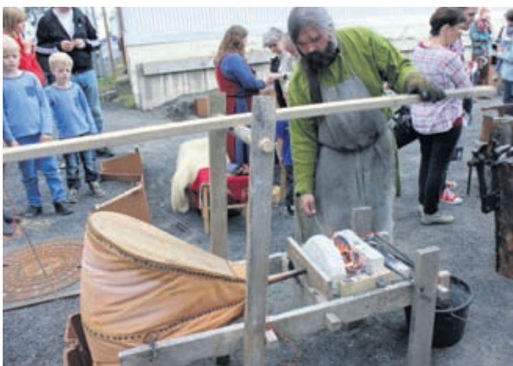
Eldsmíðir að störfum en þeir munu hamra járn í Fógetagarðinum á Safnanótt.