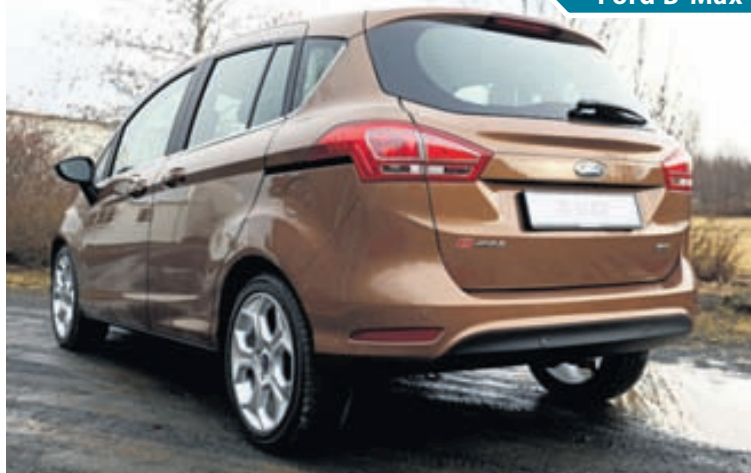
Ótrúlega rúmur og notadrjúgur lítill bíll og kjörinn fyrir barnafjölskyldur