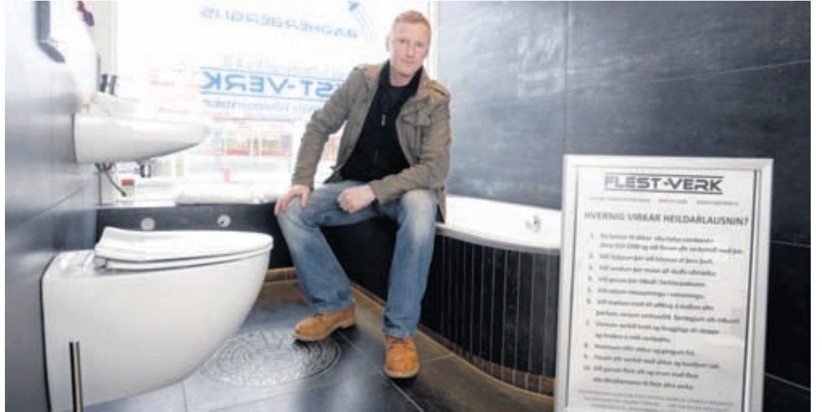
Guðmundur segir fyrirtæki eins og Flest-Verk lengi hafa vantað en þar eru allir iðnaðarmenn á einum stað.

Þessi óvenjulega sturta er hugarsmíð verkfræðinga hjá fyrirtækinu Dornbracht. Þessi sturta er búin tækninni „Ambiance Tuning Technique“ sem gerir fólki kleift að njóta mismunandi hita og þrýstings í sturtunni.