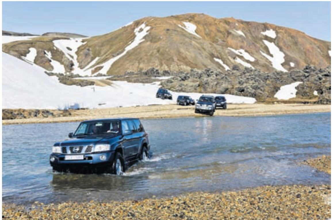
Félagar í ferðaklúbbnum 4x4 aka í vatninu hver af öðrum í Landmannalaugum.

Ferðaklúbburinn 4x4 hefur haldið margar jeppasýningar gegnum árin. Fyrsta sýningin var haldin í porti Austurbæjarskólans árið 1985. Næstu þrjár sýningar voru haldnar í Reiðhöllinni í Víðidal, árin 1987, 1989 og 1991. Síðar var haldið með sýningarnar í Laugar-dalshöllina og voru þær þar árin 1993, 1995, 1998 og sú síðasta árið 2001. Eftir það voru sýningarnar fluttar í Fífuna í Kópavogi. Hafa þær aukið hróður Ferðaklúbbsins til muna og þótt hin besta skemmtun. Nokkrar stórar hópferðir hafa verið farnar á vegum félagsins. Sú fyrsta, árið 1987 sem nefnd var 100 bíla ferðin. Skyldi ekið norður Sprengisand, en ferðin mistókst. Síðar var farin samvinnuferð með Bílabúd Benna sem kölluð var