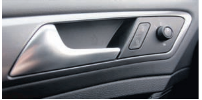
Að innan er Golf samur við sig, stílhreinn, einfaldur, falleg stjórnþæki, góð efnisnotkun og umfram flest annað, vel smíðaður.