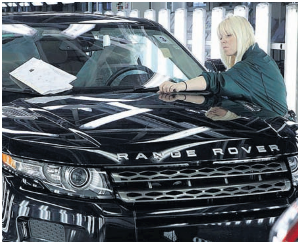
Starfsmaður í verksmiðju Land Rover leggur síðustu hönd á Range Rover bíl.

Framleiðsla Jaguar og Land Rover í Bretlandi er keyrð í botni til að hafa við eftirspurninni um allan heim og viðbótarframleiðsla á Indlandi og Kína mun líklega ekki verða til þess að störf tapist þar, svo mikil er eftirspurnin um allan heim. Starfsmenn Jaguar/Land Rover í Bretlandi eru 24.000 talsins. Fyrirtækið er einnig að íhuga verksmiðju í Sádi-Arabíu, en framleiðslan í henni á að hefjast árið 2017. Svo miklar eru fjárfestingar Jaguar/Land Rover í nýjum samsetningarverksmiðjum að hætt er við neikvæðu fjárstreymi hjá fyrirtækinu í ár þrátt fyrir gríðarlega góða sölu og hefur fyrirtækið tilkynnt um þá líklegu staðreynd. Land Rover ætla að frumsýna Range Rover Evoque með nýrri 9-gíra sjálfskiptingu, sem og rafknúinn Land Rover Defender á bílasýningunni sem hefst í dag í Genf.