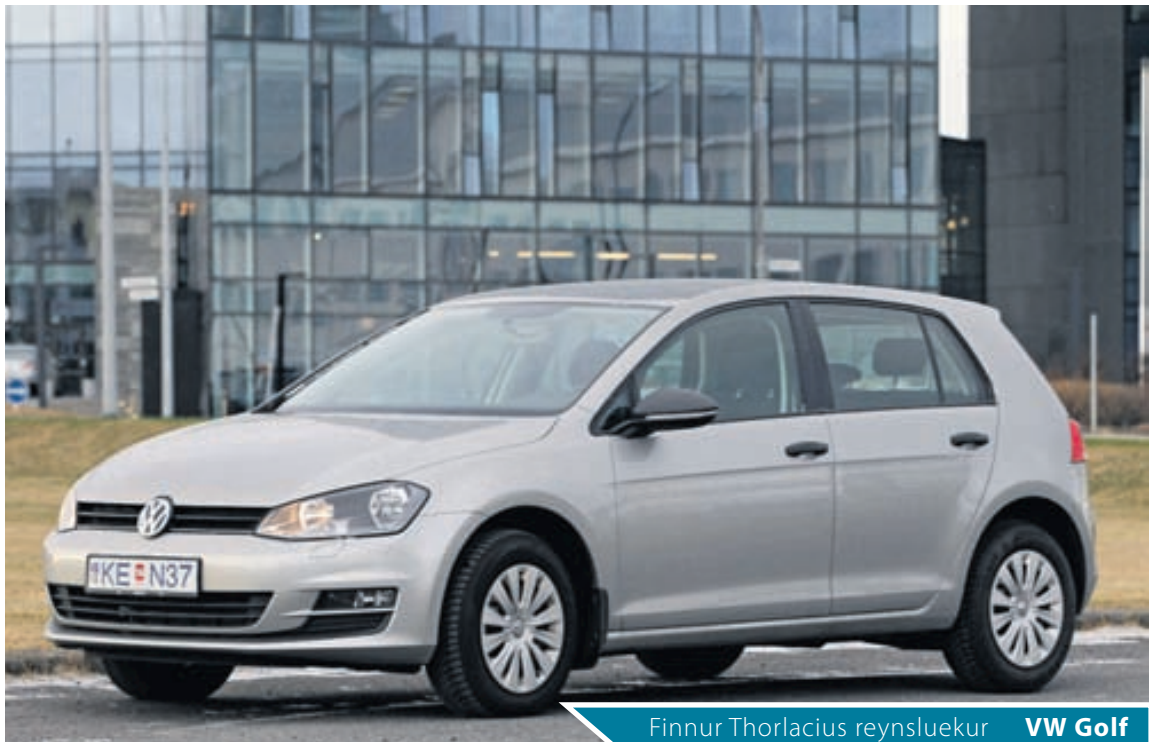
Finnur Thorlacius reynsluekur VW Golf

Dísilvélin er mjög sparneytin, togíð gott og uppgefin eyðsla í blönduðum akstri 3,8 lítrar. Í fjörlegum reynsluakstri eingöngu innanbæjar, þar sem allir kostir bílsins voru framkallaðir, var eyðslan 5,5 lítrar. Ef bensínbílnum er hins vegar rösklega ekið rýkur eyðsla hans upp. Ástæða þessa er túrbínan sem sturtar inn bensíni ef bensínfóturinn er þungur. Uppgefin eyðsla bensínbílsins er 5,2 og í innanbæjarakstri 6,6. Við mjög lífligan akstur fór hann þó fljótt í um 9 lítra. Það reyndist hins vegar ekkert mál að kalla fram uppgefna eyðslu við hóflegan akstur. Von er á Golf í BlueMotion-útfærslu og sá bíll eyðir aðeins 3,2 lítrum og mengar 85 g CO 2 .