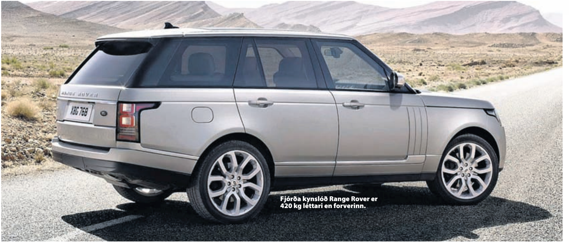
Fjórða kynslóð Range Rover er 420 kg léttari en forverinn.