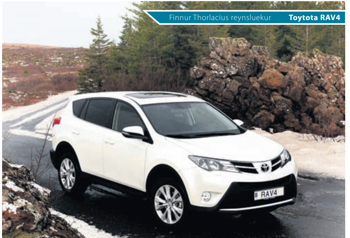
Finnur Thorlacius reynsluekur Toyota RAV4

Bíldshöfða 12 • 110 RVK • 577 1515 • www.skorri.is