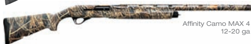
Affinity Camo MAX 4 12-20 ga