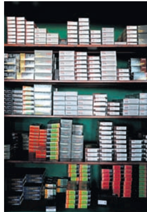
Árlega framleiðir Hlað 400 þúsund haglaskot fyrir veiði.

framleiðir Blaser einnig F3-haglabyssur í hæsta gæðaflokki.“