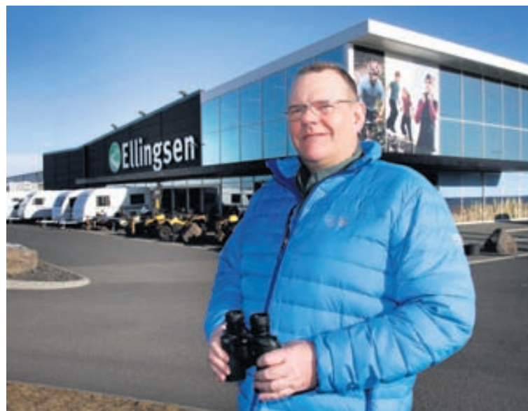
Sveinbjörn segir veiðimenn aðallega sækjast eftir útiveru og snertingu við náttúruna. Veiðinni fylgir þó líka ákveðin spennu, auk þess sem gaman er að bjóða upp á eigin bráð.