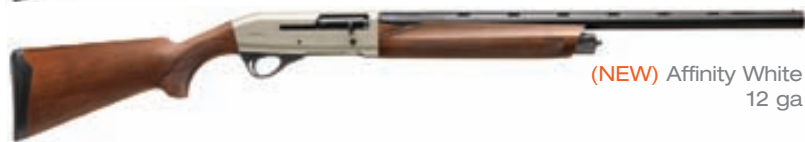
(NEW) Affinity White 12 ga

Veiðihúsið Sakka ehf Hólmaslóð 4 101 Reykjavík Íceland