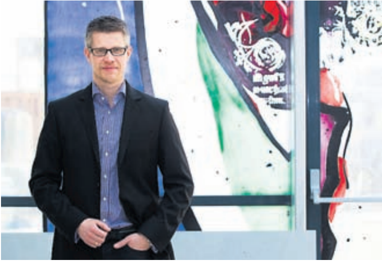
Ákvörðunarvald um veiði á villtum stofnum er í höndum nokkurra aðila. Að mati Elvars er þörf á frekari samræmingu við ákvörðun um veiði á villtum stofnum.