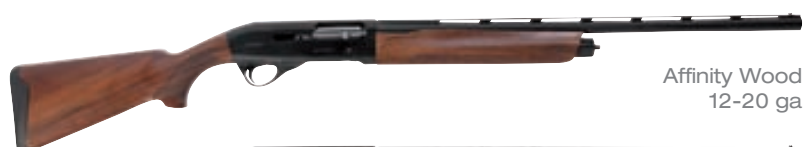
Affinity Wood 12-20 ga