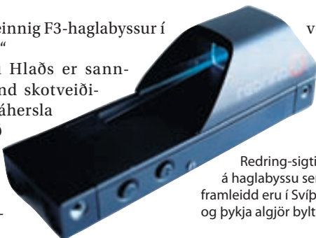
Redring-sigti á haglabyssu sem framleidd eru í Svíþjóð og þykja algjör bylting.

Reykjavíkúrútibú Hlaðs er sannkallað draumaland skotveiðimannsins. Mikil áhersla hefur verið lögð á riffilskotfimi, jafnt fyrir íþrótta-skotmenn sem veiðimenn. Skot-