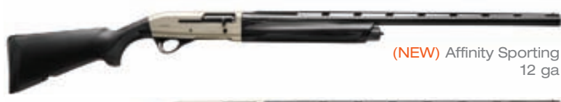
(NEW) Affinity Sporting 12 ga