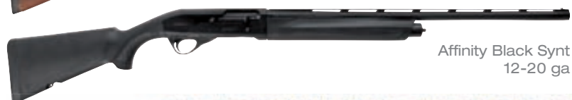
Affinity Black Synt 12-20 ga