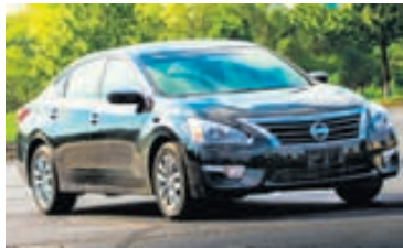
Nissan Altima selst vel í Bandaríkjunum.