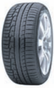
Nokian WR A3

Nokian i3 heldur góðu gripi bæði við lágt hitastig og í rigningu, reynist frábærlega við flot í bleytu og veitir framúrskarandi aksturs-eiginleika fyrir litla og meðalstóra fólksbíla.