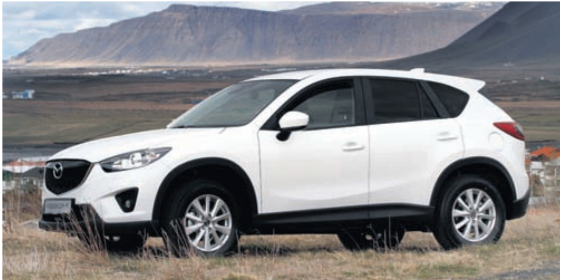
Mazda CX-5 er mjög vel heppnaður bíll, bæði útlitslega sem og að öðru leyti.

Hámarkshraði 187 km/klst Verð 5.690.000 kr. Umboð Brimborg