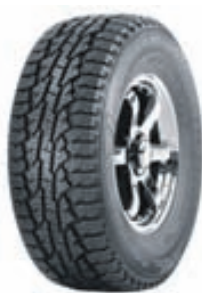
Nokian Rotiiva AT

Nokian Line sumardekkið er framúrskarandi. Það gefur besta mögulega gripið, frábæra akstursupplifun og er sérstaklega gott í bleytu.