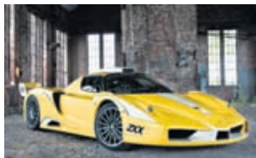
Ferrari Enzo ZXX

Fjórði ársfjórðungur Nissan var fyrirtækinu drjúgur í sölu og það hjálpaði mjög upp á að nýjar bílgerðir voru tíu talsins. Nissan segist ætla að framleiða 5,3 milljónir bíla á þessu ári og vaxa því um 7,8%. Veltan á að verða 118 milljarðar dala. Svo lítil hækkun veltu bendir til þess að Nissan muni framleiða meira af smáum og ódýrum bílum en það gerði á síðasta uppgjörsári.