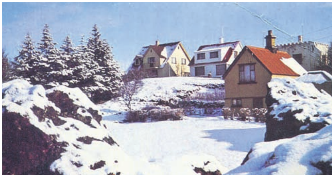
Hellisgerði í vetrarbúningi. Markmið garðsins var meðal annars að varðveita óskráðar minjar um hið sérkennilega bæjarstæði Hafnarfjarðar.