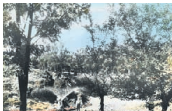
Handlituð svarthvít mynd úr garðinum frá því um 1956.