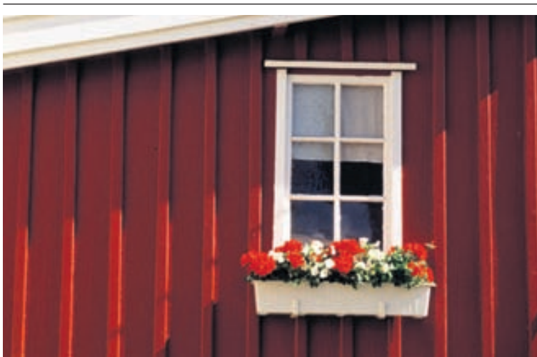
Hægt er að fá blómabox af ýmsum toga bæði til að festa fyrir utan glugga og á svalahandrið.

Ráektun mat- og kryddjurtu stendur fram á haust eða þar til fyrsta frostið skellur á. „Það er auðvitað misjafnt hvenær það skellur á, alveg eins og vorin eru misheit. Eftir fyrsta frostið getum við nýtt til dæmis grænkálið, rósakálið og kartöflurnar en um leið og kartöflugrósin falla hætta kartöflurnar að stækka og því borgar sig að taka þær upp á þeim tíma.“