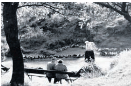
Á níutíu ára tímabili hafa bæjarbúar og aðrir notið góðra stunda í Hellisgerði.