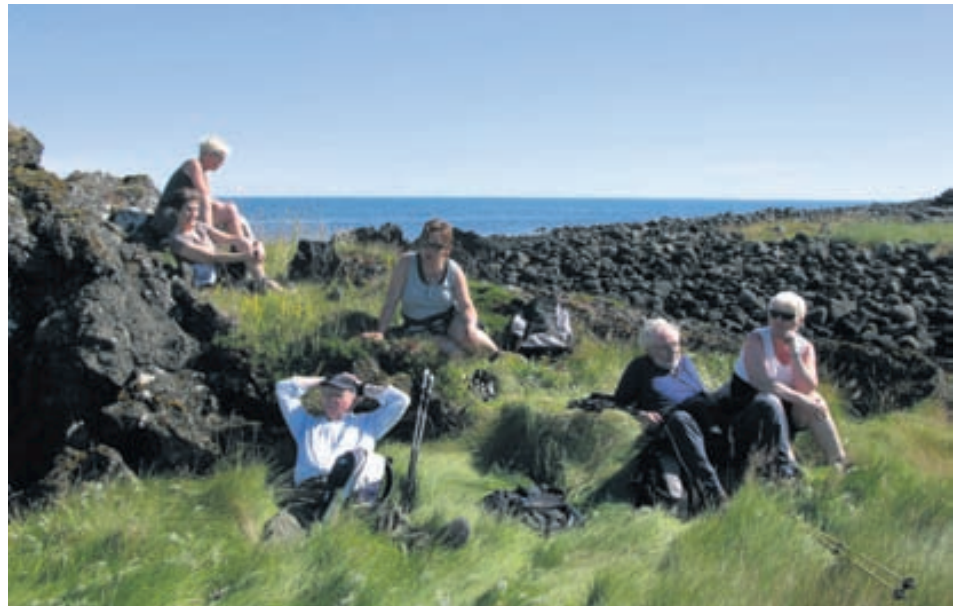
Að eftir sumargöngu í Búðahrauni.