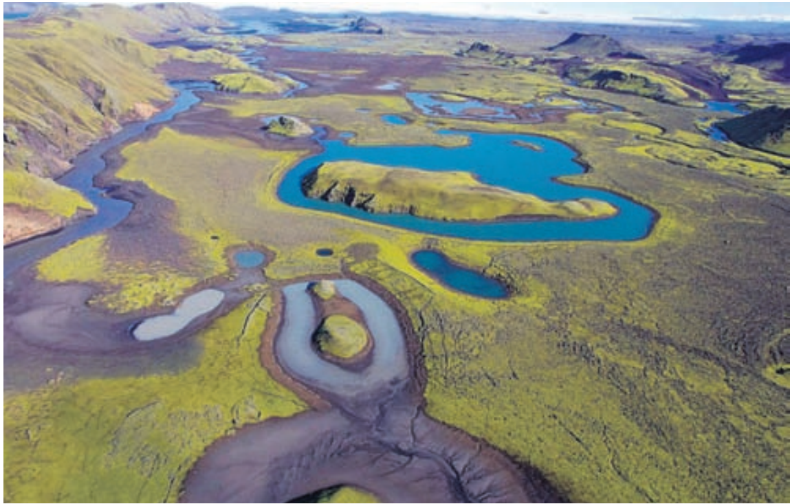
Eldhraun norðan Kamba.