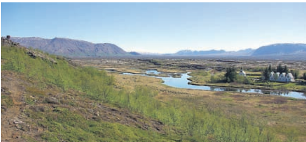
Aðstaðan á Þingvöllum verður stórbætt í sumar.