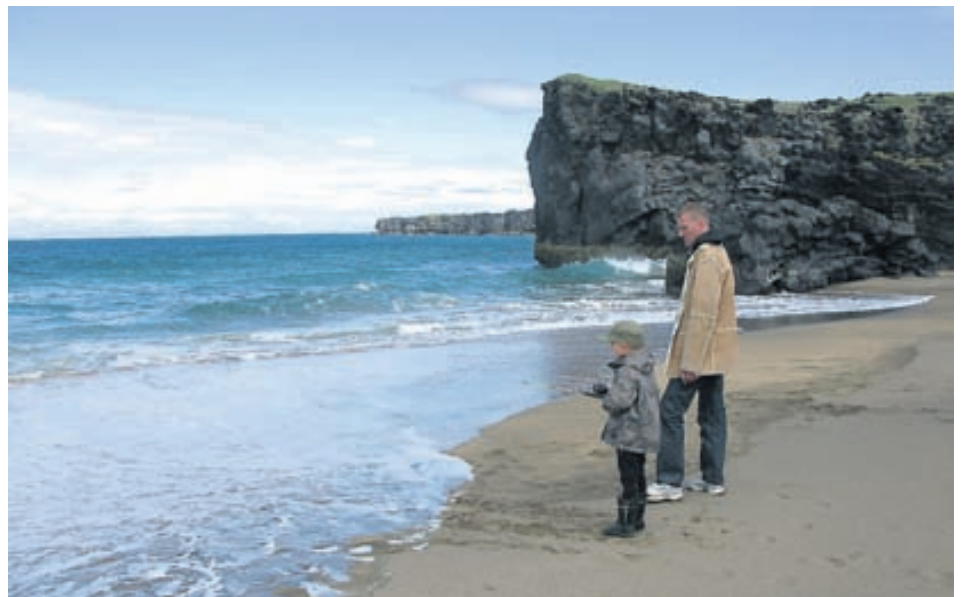
Rennt eftir fiski í Skarðsvík.