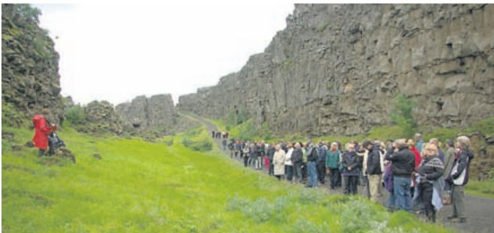
Ávallt eru í boði gönguferðir um Þingvelli með leiðsögn en þær hafa notið mikilla vinsælda.

Gönguferðirnar hefjast klukkan 20.00 frá fræðslumiðstöðinni við Hakið og er gengið niður Almanna-gjár að Lögbergi og síðan í þá átt sem viðfangsefninu hentar. Léttar gönguferðir þar sem fræðslan er í fyrirrúmi og þekking og skoðanir leiðsögumanns fá að njóta sín.