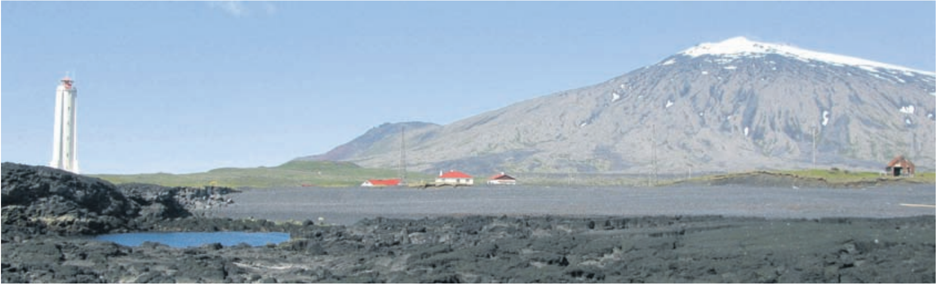
Um þriggja tíma akstur er frá Reykjavík í Þjóðgarðinn Snæfellsjökull og malbik alla leið. Hér sést Snæfellsjökull frá Malarrífi.