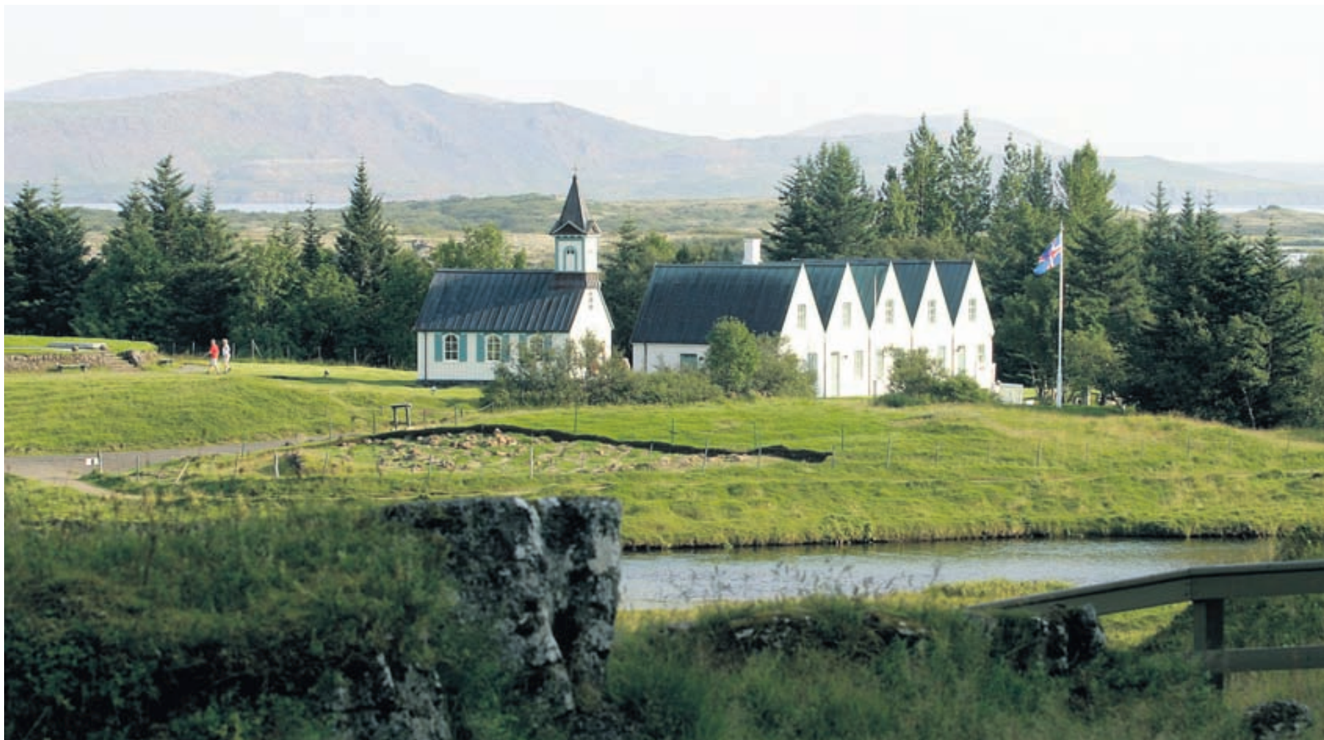
Útlendum ferðamönnum þykir afar skemmtilegt að koma í litlu, fallegu kirkjunu á Þingvöllum.