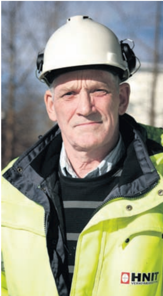
Steinar segir persónuhlífum ætlað að verja fólk þegar ekki er hægt að fjarlægja utanaðkomandi hættu á annan hátt.

Samfara þessu hefur umtalsvert dregið úr slysa-tíðni. Það má meðal annars merkja mjög jákvæða þróun í yngri aldurshópum. Hins vegar er það enn þá svo að karlar á bilinu 18 til 30 lenda frekar í slysum en aðrir en þar spila kannski aðrir þættir inn í eins og kappsemi, reynslu- og þekkingarleysi.