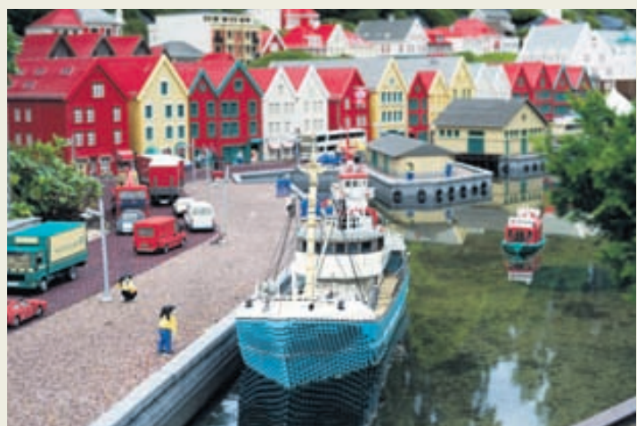
Lególand er byggt úr meira en 60 milljónum legókubbum sem gerðir eru úr plasti.

Sjá meira á www.merking.is og www.format.is .