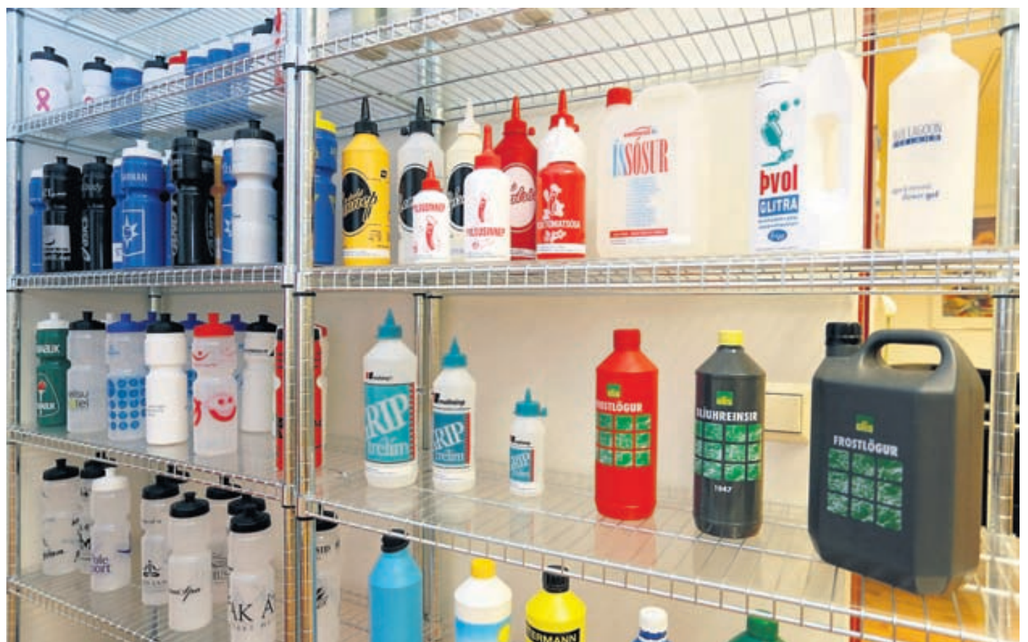
Sigurplast býður viðskiptavinum upp á fjölbreyttar heildarlausnir í umbúðamálum, hönnun og dreifingu.

Framleiðsla fyrirtækisins fer fram í Mosfellsbæ en þangað flutti fyrirtækið starfs-