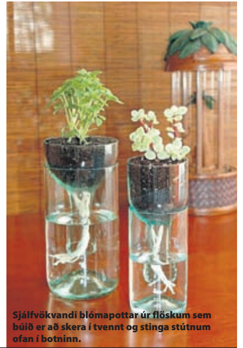
Sjálfvökvaði blómavottar úr flöskum sem búið er að skera í tvennt og stinga stútnum ofan í botninn.