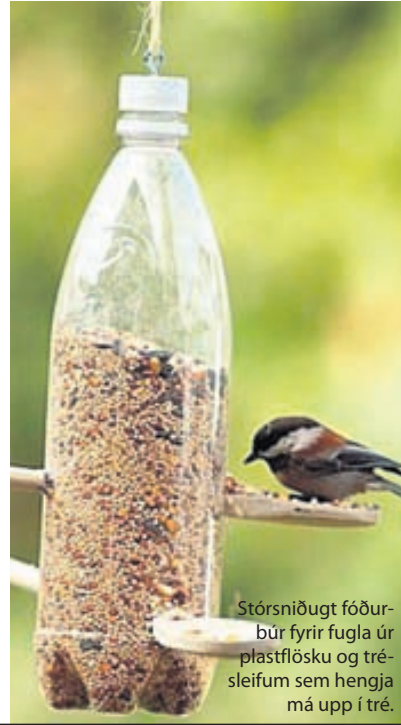
Stórsniðugt fôðurbúr fyrir fugla úr plastflösku og trésléifum sem hengja má upp í tré.

Plastpoka og plastlát ýmiss konar má nota til margvíslegra hluta þegar hefðbundnu hlutverki þeirra lýkur. Poka má til að mynda klippa niður í lengjur og hekla úr þeim töskur og mottur og flöskur og brúsar geta breyst í hirslur undir smáhluti og jafnvel í lítill gróðurhús. Á Pinterest má finna óteljandi hugmyndir að sniðugum hlutum úr gömlu plasti.