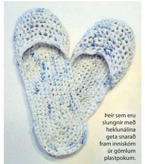
Þeir sem eru slungnir með heklunálina geta snarað fram inniskóm úr gömlum plastpokum.