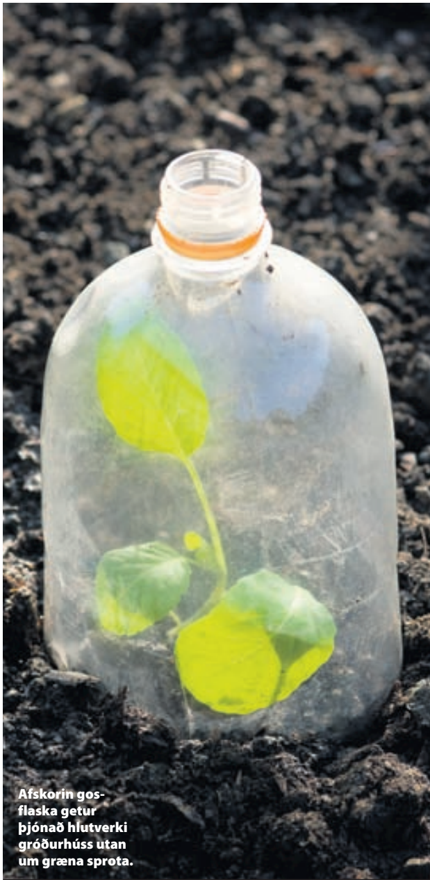
Afskorin gosflaska getur þjónað hlutverki gróðurhúss utan um græna spróta.