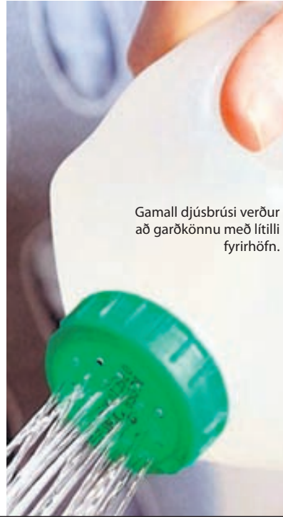
Gamall djúsbrúsi verður að garðkönnu með lítilli fyrirhöfn.