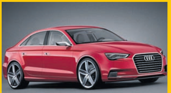
Audi A3 sedan verður best útbúni bíll Audi hvað tæknina varðar þrátt fyrir að vera næstmínsti framleiðslubíllinn.