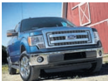
Söluhæsti bíllinn í Bandaríkjunum þetta árið er pallbíllinn Ford F150.

Nýjasta útfærsla VW Golf bílsins eyðir litlum 3,2 lítrum á hundraðið.