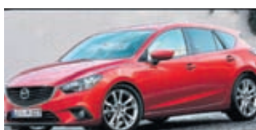
Mazda3 af árgerð 2014 ber keim af Mazda6, sem mörgum þykir einkar fagur bíll.

Fjögur síðustu ár hefur söluhæsta einstaka bílgerðin í Bandaríkjunum, sem framleidd er að fullu þar, verið Toyota Camry. Breyting gæti orðið á því þar sem söluhæsti bíllinn þetta árið er nú pallbíllinn Ford F150, en sá bíll var sá söluhæsti þrjú ár á undan góðu söluárum Camry. Þessi breyting er nokkuð lýsandi fyrir ágæta sölu amerískra pallbíla og almennt góða sölu þarlandra framleiðenda. Söluaukningin á Ford F-150 það sem af er ári nemur 22 prósentum. Engu að síður er Toyota söluhæsta bílamerkið í Bandaríkjunum eins og í fyrra og slær þar við þremur stærstu amerísku merkjunum. Í næstu sætum á eftir hinum einstökum gerðum F-150 og Camry eru svo Dodge Avenger, Honda Odyssey, Toyota Sienna, Chevrolet Traverse, Toyota Tundra, GMC Acadia, Buick Enclave og Toyota Avalon í tíunda sæti.