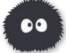
Sumir límniðar hafa engan sérstakan tilgang.