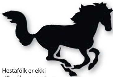
Hestafólk er ekki síður áhugasamt um að koma sínu áhugamáli á framfæri með smekklegum límniða á bílrúðunni.