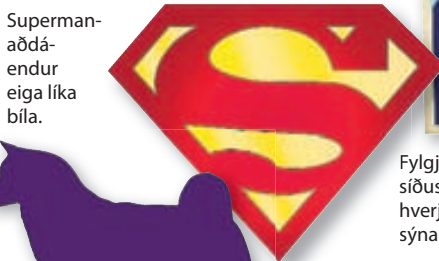
Superman-aðdáendur eiga líka bíla.