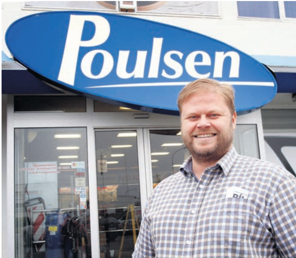
Poulsen þjónustar bæði bíleigendur og bifreiðaverkstæði. Þar starfa fagmenn með áralanga reynslu.