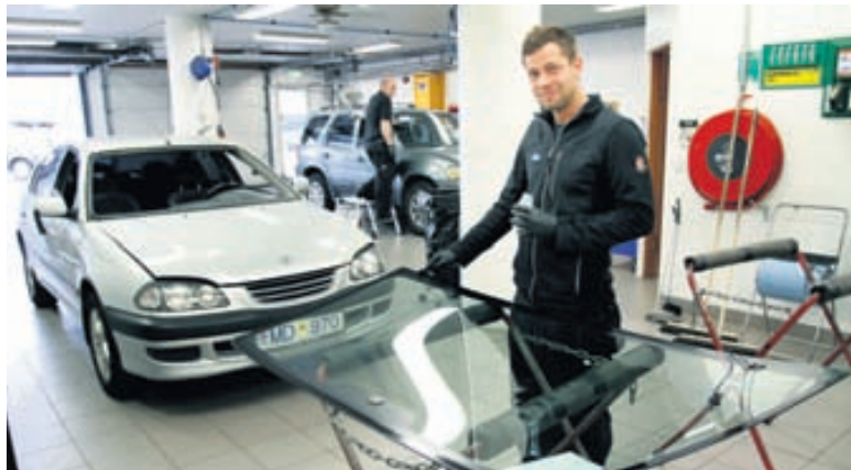
Það er vandaverk að skipta um bílrúður. Starfsfólk Poulsen vinnur eftir ströngum vinnureglum sem tryggja að ávallt er vandað vel til verka.