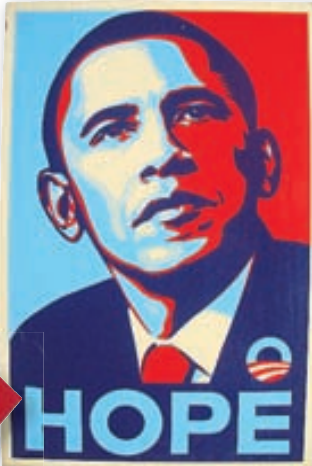
Fylgjendur Obamas í forsetakosningunum síðustu í Bandaríkjunum límdu margir hverjir svona límniða á bíla sína til að sýna forsetanum stuðning.