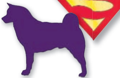
Hundaeigendur eru flestir afar stoltir af sinni hundategund og vilja koma henni á framfæri, til dæmis með límniða á borð við þennan sem límdur er í afturrúður margra bíla.