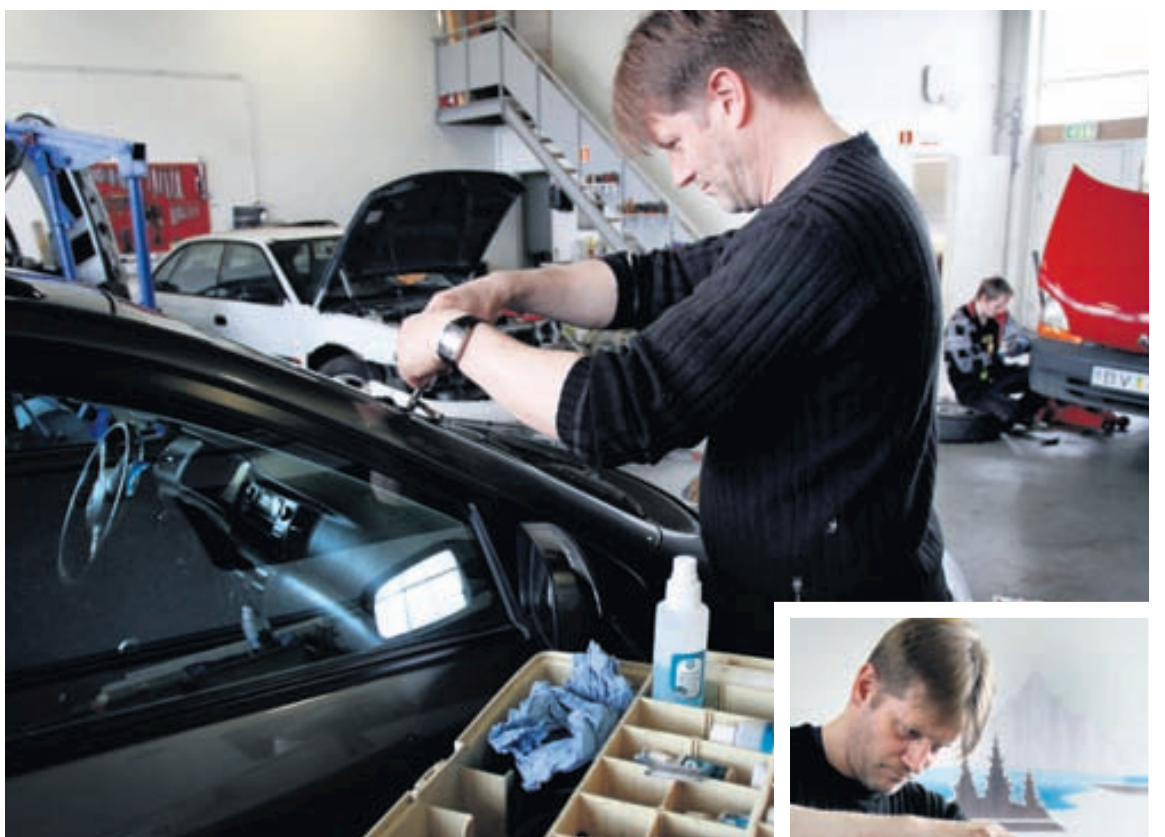
Rúðuviðgerðir eru vandasamt verk en starfsmenn Glerpró einsetja sér að vinna bæði hratt og vel.