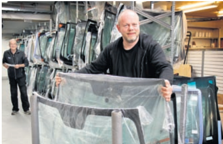
Poulsen flytur inn stærstu merkin í bílrúðum og býður upp á rúður í flestar gerðir bíla.