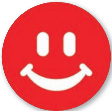
Sumir vilja bara gleðja náungann og fátt er betra til þess en brosmildur broskall.

Límniðar í bílrúðum eru af ýmsu tagi. Þeir geta verið myndir skilaboð til hinna í umferðinni eða lýst áhugamálum eða skoðunum bíleigandans. Þannig eru hunda- og hestaeigendur duglegir að líma sitt uppáhaldsdýr á bílinn og einlægir stuðningsmenn stjórnmálamanna lýsa yfir stuðningi sínum við frambjóðendur með því að líma slagorð eða myndir í afturgluggan.