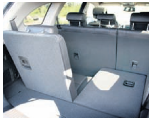
Chevrolet Captiva fæst með þremur sætaröðum.