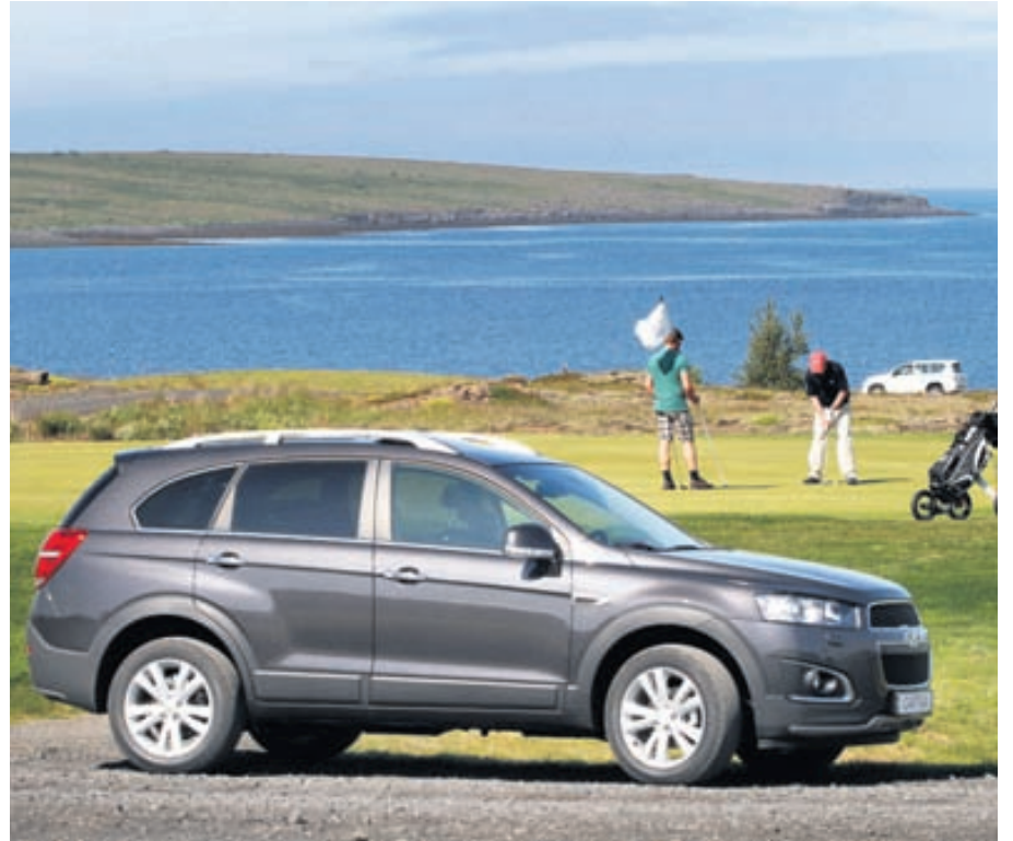
Captiva er í stærri gerðinni af jeplingum.