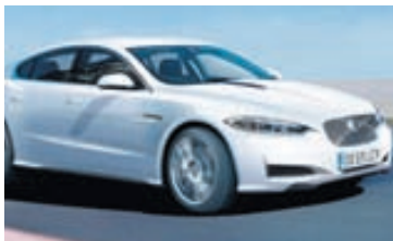
Jaguar vill auka söluna með smábílum.