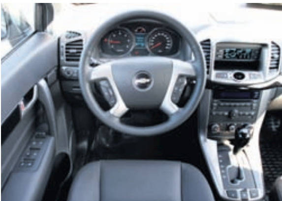
Ágæt stjórnþæki og mælur en efnisnotkun í ódýrari kantinum.