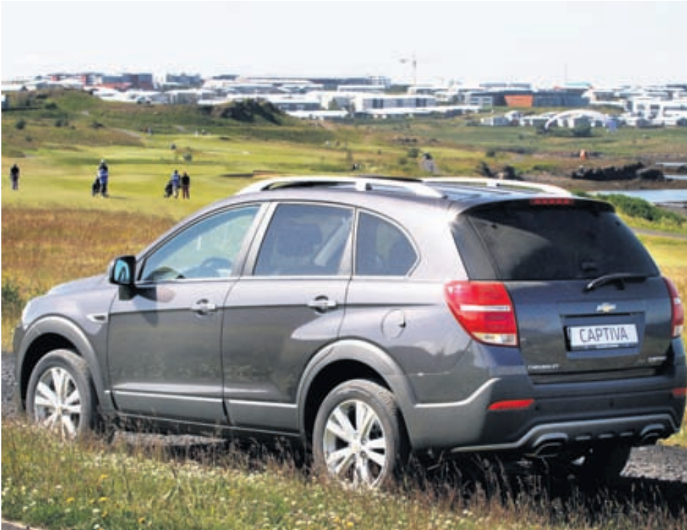
Laglegar og mjúkar línur einkenna bílinn.