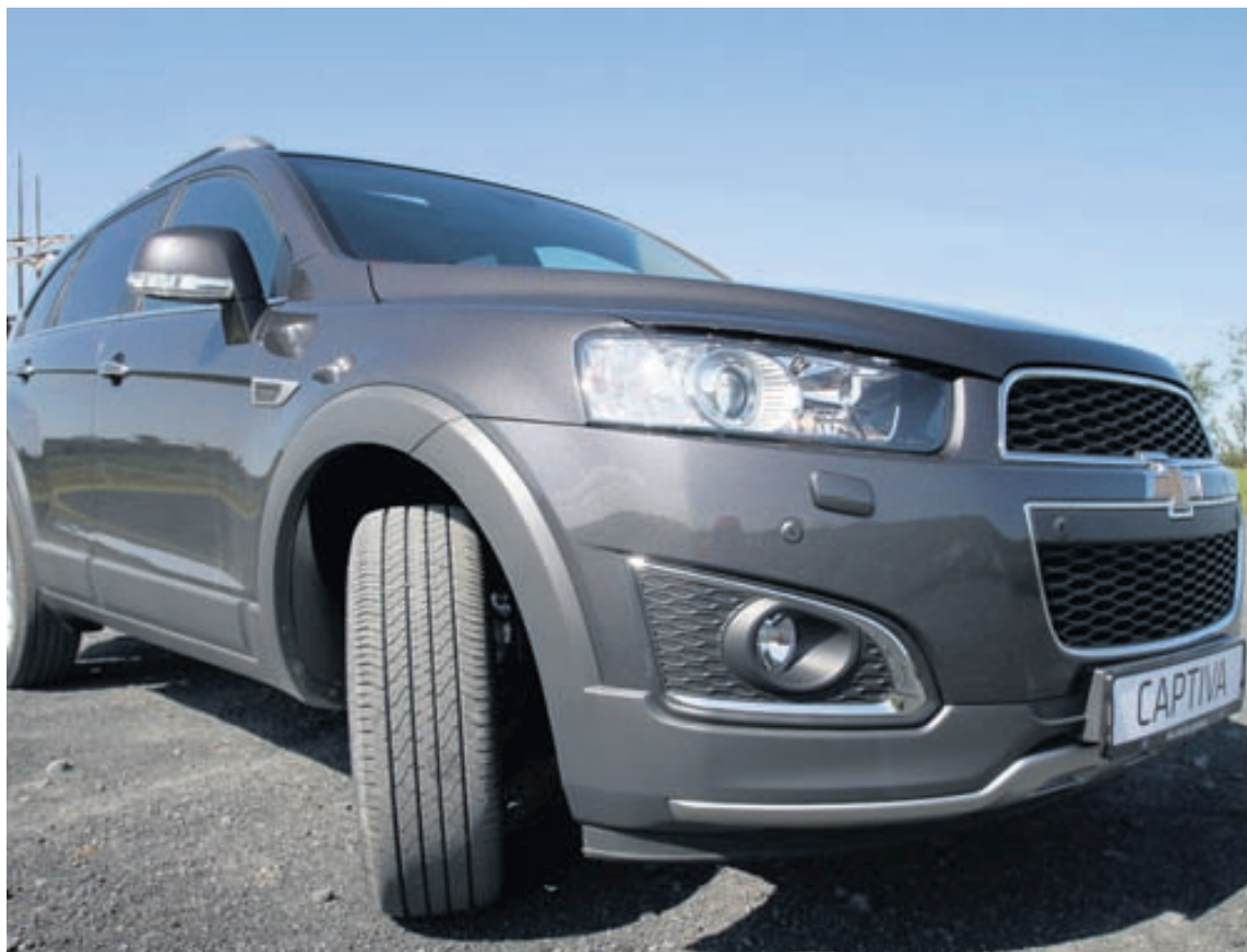
Kraftalegur framendi sem sver sig í ætt við aðrar bílgerðir Chevrolet.

Leðurinnrétting, panorama sóllúga, lykjalaust aðgengi, hæglokun / opnun á afturhlera, dráttarbeisli, 21" álfelgur, þægindasæti, simkerfi, aðgerðarstýri, dökkar hliðarrúður að aftan, léttstýri, tvöföld miðstöð með loftkælingu, forhitari með tíma og fjarstýringu, rafdrifin þæginda-sæti, innbyggður bílskúrshurðaðopnari o.fl.