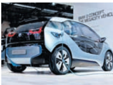
BMW i3 gengur aðeins fyrir rafmagni.

Uppi er hugmyndir hjá breska bílasmiðnum Jaguar að bjóða upp á smærri bíla en fyrirtækið hefur áður framleitt og að þeir verði með yfirbyggingu eingöngu úr áli. Um yrði að ræða bíl á stærð við BMW 3 og Mercedes Benz C-Class, jeppling á stærð við Range Rover Evoque og langbak af minni gerðinni. Þessir bílar yrðu líklega smíðaðir í verksmiðjum Land Rover, en Jaguar og Land Rover eru eitt og sama fyrirtækið. Jaguar selur um helmingi færri bíla en Land Rover og hefur Jaguar uppi áætlanir um að nálgast Land Rover í sölu með þessum nýju bílum. Jaguar Land Rover hefur gert risasamning um kaup á áli við einn af stærstu álframleiðendum heims í Sáði-Arabíu. Jaguar Land Rover ætlar að verja 515 milljörðum króna á ári á næstu fjórum árum við þróun nýrra bíla og nýrra verksmiðja. Það eru ekki litlir peningar, svo eðlilegt má teljast að fyrirtækið sé nú að huga að nýjum gerðum fyrir nýja markhópa. Sala Jaguar Land Rover á fyrsta helmingi ársins var 14% meiri en í fyrra og má því segja að gengi fyrirtækisins sé með besta móti, sem alls ekki á við flesta bílaframleiðendur í Evrópu. Verulega góða sala í Kína á mestan þátt í þessari aukningu. Jaguar mun láta uppi áætlanir sínar á bílasýningunni í Frankfurt í september og vonandi mun fyrirtækið sýna þar hugmyndir að þessum þremur nýju bílum.