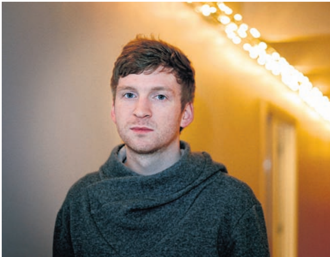
Ólafur Arnalds segir það hafa verið skemmtilegt verkefni að vinna við Broadchurch.