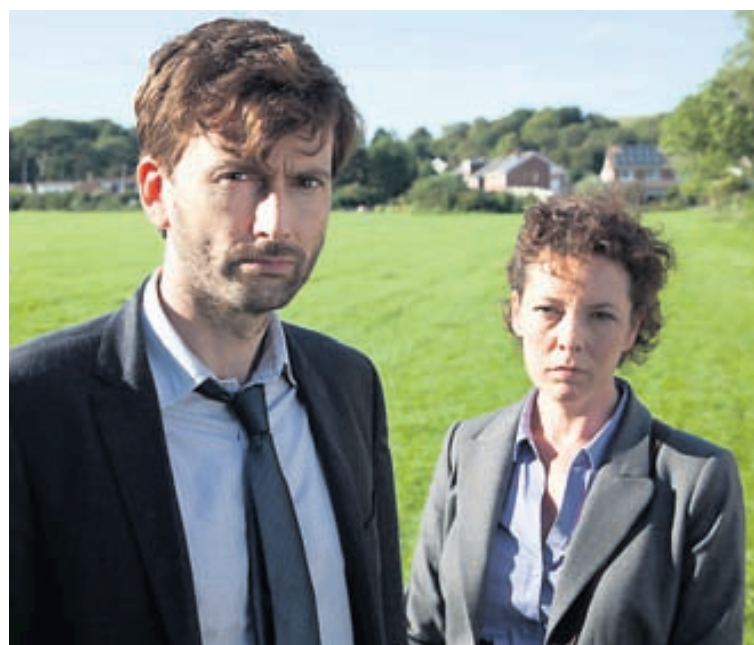
David Tennant, sem leikur Alec Hardy, og Olivia Colman í hlutverki Ellie Miller í sjónvarpsþáttunum Broadchurch.