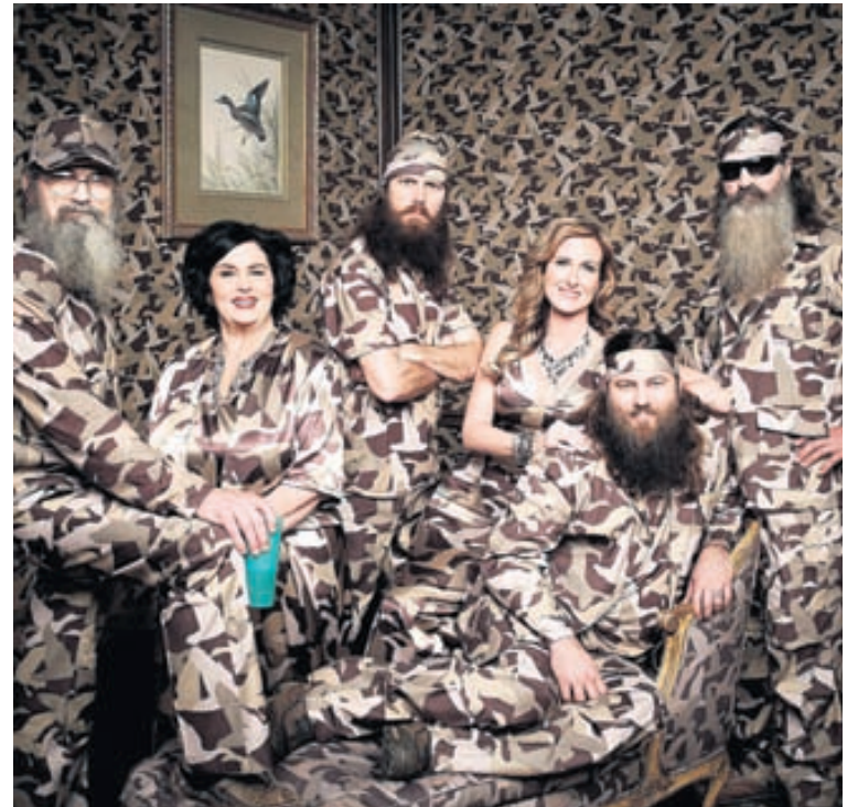
Á stöðinni eru sýndir raunveruleikaþættir í bland við sögulegt efni. Einn vinsælasti þátturinn um þessar mundir er Duck Dynasty.

Eitt stærsta vandamál forstjóra fyrirtækisins, Willie Robertson, er að halda starfsmönnum við efnið en hugur þeirra leitar hvað