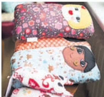
Koddakrílin eru í ýmsum stærðum og gerðum.