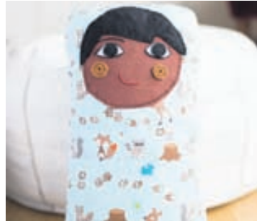
Innblástur koddakrísins var sonurinn.