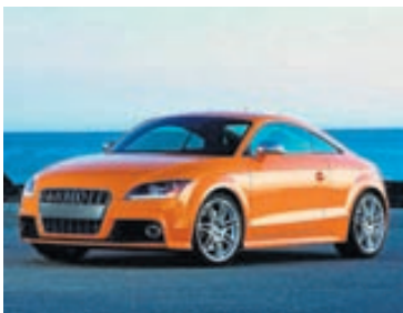
Audi TT hefur selst vel

Viðræður um launa- og bónusmálin hjá Hyundai hófust í maí og hjá Kia í júlí, en greinilega ekki með betri árangri en þetta. Í fyrra varð Hyundai af framleiðslu 82.000 bíla vegna verkfalla starfsfólks og tapaði miklum fjármunum á því. Ef öll verkföll starfsfólks í bílaverksmiðjum Hyundai sl. 26 ár eru lögð saman hefur Hyundai orðið af framleiðslu einnar milljón bíla. Ofan á þessi vandræði hefur gjaldmiðill S-Kóreu styrkst um 26% miðað við japanska jenið og því hefur samkeppnishæfni Hyundai- og Kia-bíla á erlendum mörkuðum versnað gagnvart japönskum framleiðendum sem því nemur. Sala Hyundai-bíla féll um 4% í Evrópu á fyrsta helmingi þessa árs, en sala Kia-bíla jókst um 1%. Er það góður árangur á markaði sem glímur við minnkandi sölu.