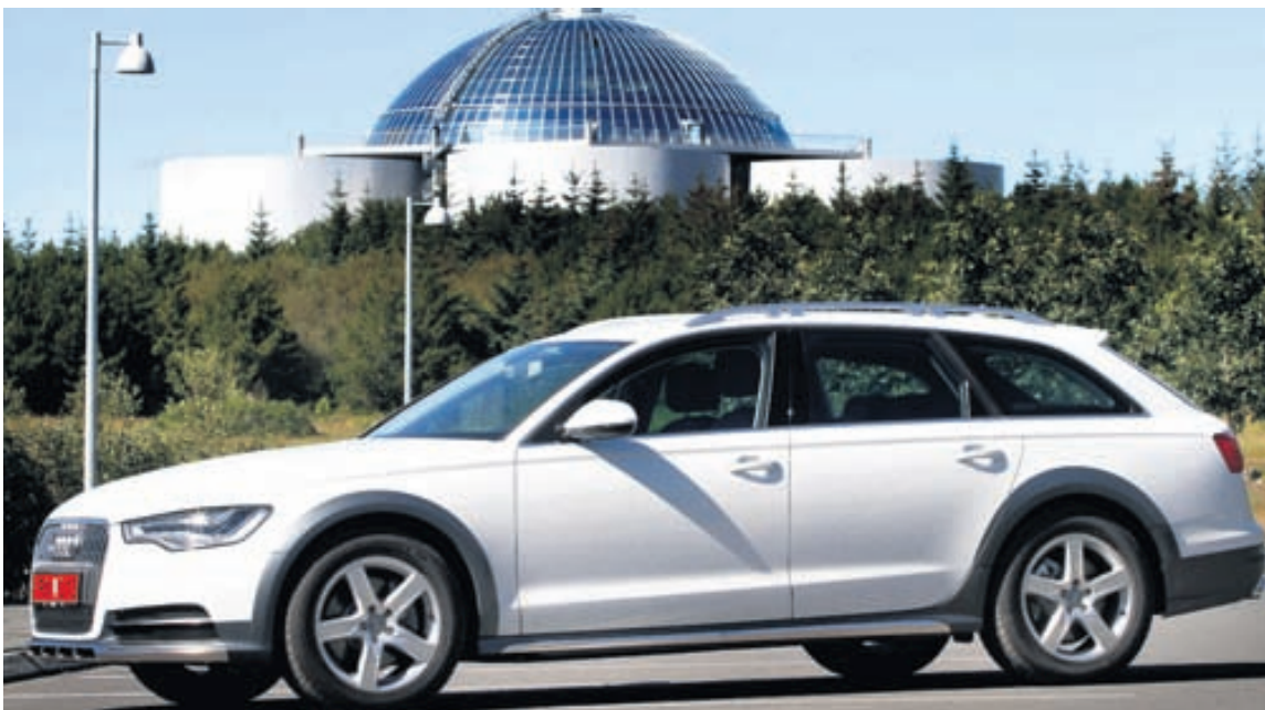
Audi Allroad er óneitanlega með fegurri bílum Audi og kamelljón í leiðinni.