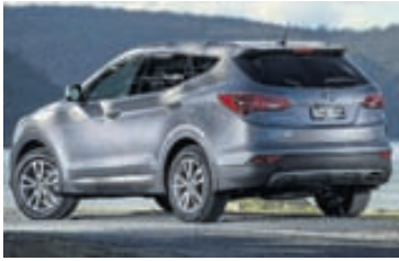
Hyundai Santa Fe sem kom af síðustu kynslóð.