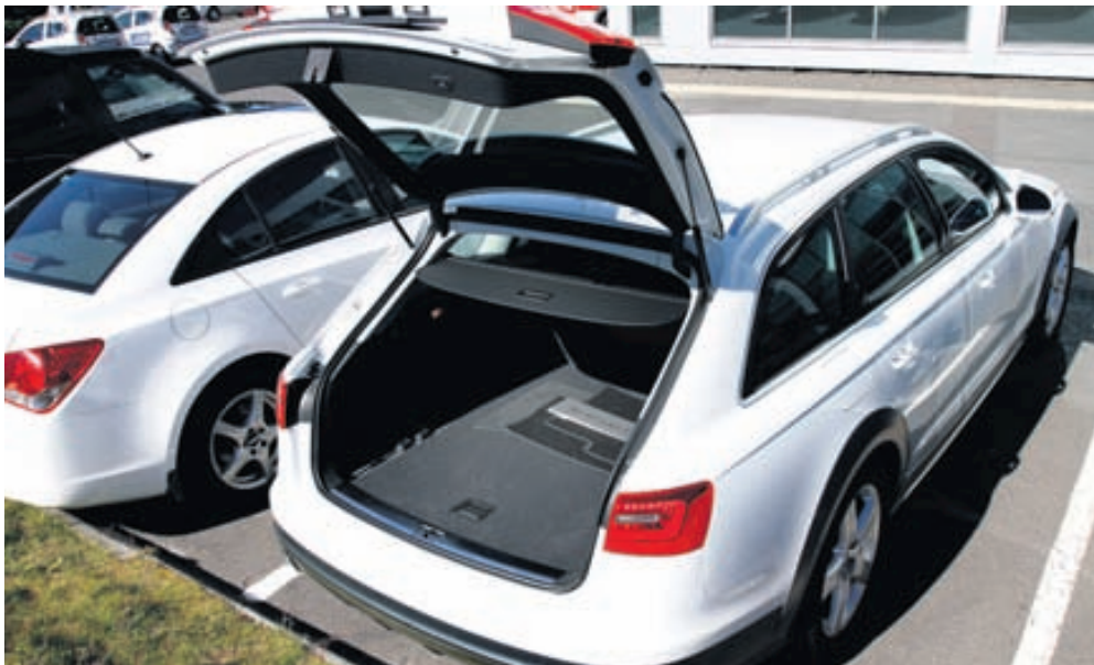
Farangursrymi Audi Allroad er gríðargott og hann því hentugur til ferðalaga.

Aksturseiginleikar Audi-bíla almennt eru til fyrirmyndar og þar er þessi bíll engin undantekning. Bíllinn er, eins og nafn hans gefur til kynna, svo til sami bíll og hinn rómaði akstursbíll Audi A6. Helsti munurinn á hefðbundnum A6 er að Allroad er með hækkanlega loftþúðafjöðrun og er það í valdi bílstjórans að hækka og lækka bílinn eftir aðstæðum, en ef hratt er farið og bíllinn í hárrí stöðu, lækkar hann sig sjálfur. Audi Allroad verður býsna vígalegur þegar hann er hækkaður í sína