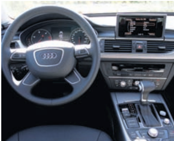
Innréttingar Audi hafa ávallt þótt glæsilegar og hér er engin undantekning frá því. Fágun í alla staði og mikil skilvirkni.

hæstu stöðu, en þá eru 20 cm undir lægsta punkt hans og eru fáir jepplingar hærri. Kosturinn við akstur Audi Allroad er sá að hann hegðar sér eins og besti sportbíll á vegi og hallar sér nær ekkert í beygjum þótt hratt sé farið. Það leika fáir jepplingar eftir. Fjöðrun bílsins fer vel með farþega og bíllinn tekur hraðahindranir bæjarins í forrétt eins og hann hlakki til næstu áskorunar. Geta Allroad í torfærum er svo annar kostur þessa bíls og hefur verið allt frá því Allroad var fyrst kynntur til sögunnar árið 2000. Frábært fjórhjóladrif Audi á þar mestan hlut að máli og bíllinn tekur ávallt mest á því hjóli þar sem veggripið er mest og frægt er hversu mikla yfirburði þessi bíll hefur framyfir marga aðra fjórhjóladrifna bíla í klifri